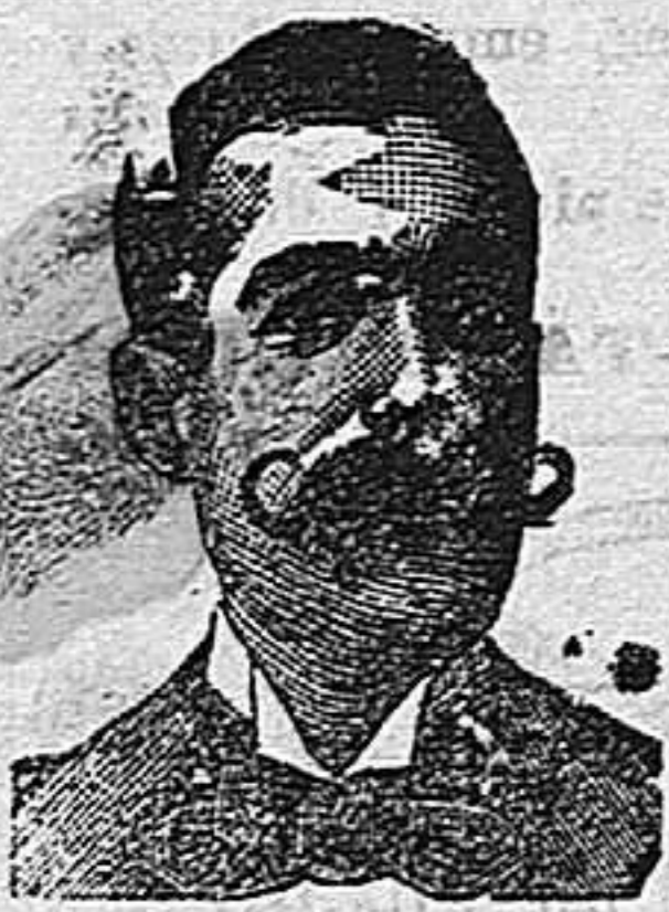
A. Salvati Costadai Diputación, 435, Barcelona

Calle de la Unión, número 38.—TARRAGONA Variado y económico surtido de gorras y sombreros de todas clases 38, Unión, 38