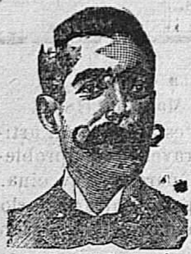
A. Salati Costanzi Diputación, 435, Barcelona