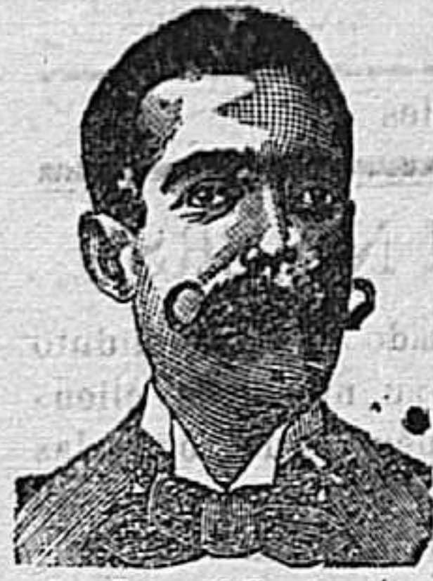
A. Sarrati Costanzi Diputación, 435, Barcelona