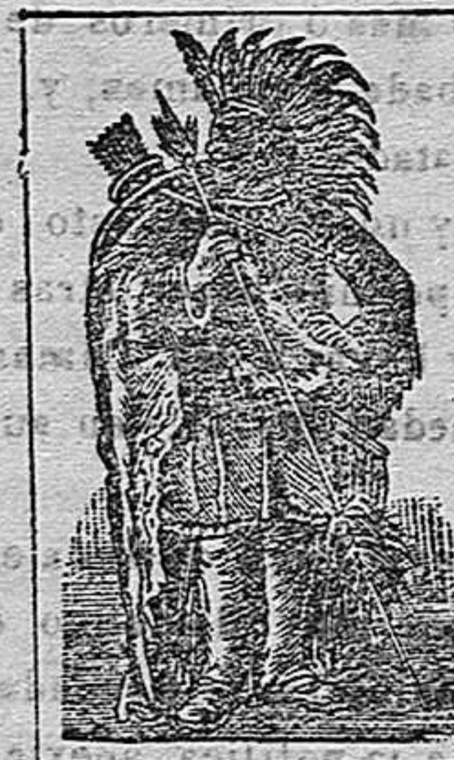
ACEITE DE SEQUAH MARCA REGISTRADA