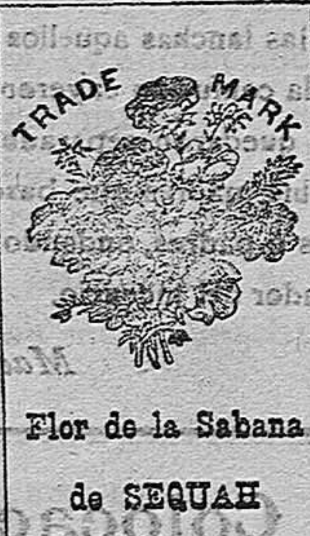
Flora de la Sabana de SEQUAH

No contienen ninguna substancia nociva. Los muchos millares de certificados de personas que deben la curación de sus enfermedades á estos dos preparados y los brillantes elogios de varias corporaciones científicas del mundo entero, son el mejor elogio que pueda desearse.