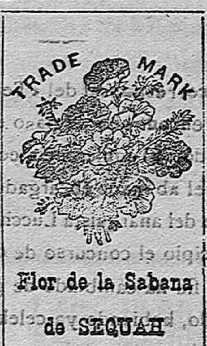
Flor de la Sabana de SEQUAH MARCA REGISTRADA

No contienen ninguna substancia nociva. Los muchos milares de certificados de personas que deben la curación de sus enfermedades a estos dos preparados y los brillantes elogios de varias corporaciones científicas del mundo entero, son el mejor elogio que pueda darse.