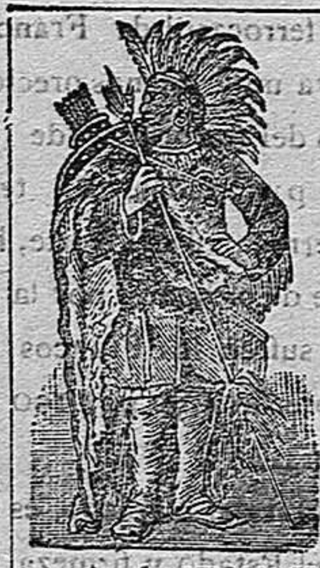
Acete de SEQUAH MARCA REGISTRADA