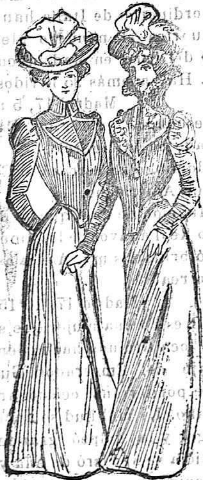
«Bófero» cruzado, de paño satín

guarnición de adorno de seda blanca; corto en el reverso del tallo y descendiendo por delante algunos centímetros. Falda del mismo color y con adornos idénticos. Sombrero de fieltro gris perla, guarnición de plumas de avestruz.