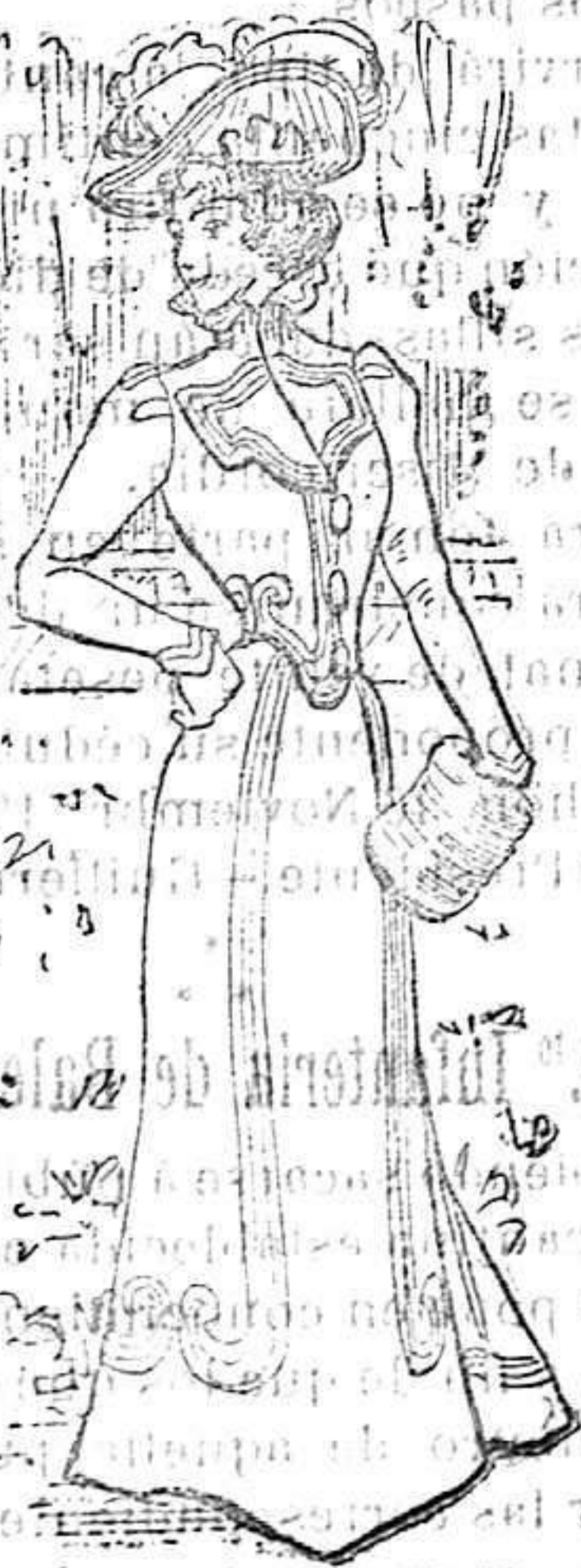
Sencillos modelos para señoritas, propios para las mañanas para ir a

guarnición de adorno de seda blanca; corto en el reverso del tallo y descendiendo por delante algunos centímetros. Falda del mismo color y con adornos idénticos. Sombrero de fieltro gris perla, guarnición de plumas de avestruz.