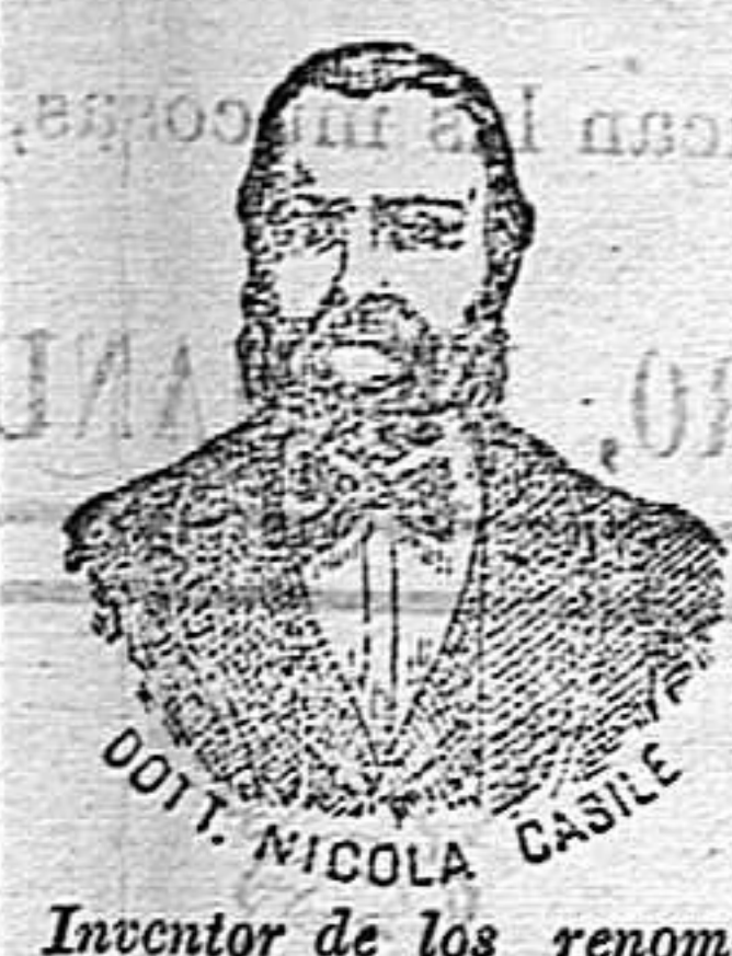
Inventor de los renombrados medicamentos CASILE.