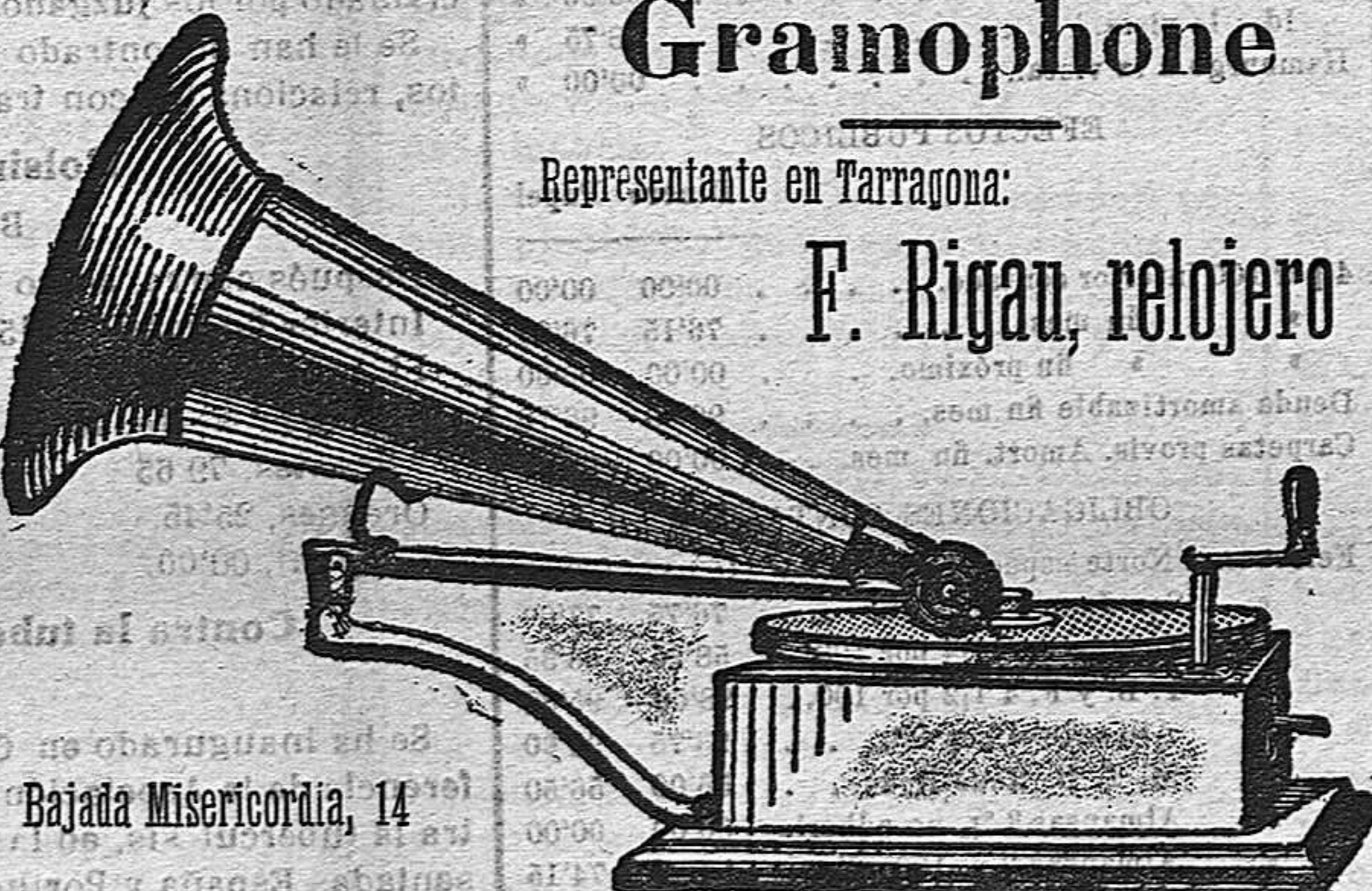
Bajada Misericordia, 14