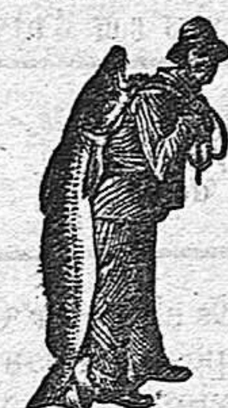
Obténase siempre la Emulsión con esta marca "El Pescador," marca del procedimiento Scott!

El intenso poder nutritivo de la Emulsión SCOTT, que salvó á este niño, solo se puede mantener escogiendo continuamente los materiales mas finos y preparándolos por el procedimiento científico de SCOTT, que deja todo el alimento en una forma fácil de digerir por el estómago mas delicado.