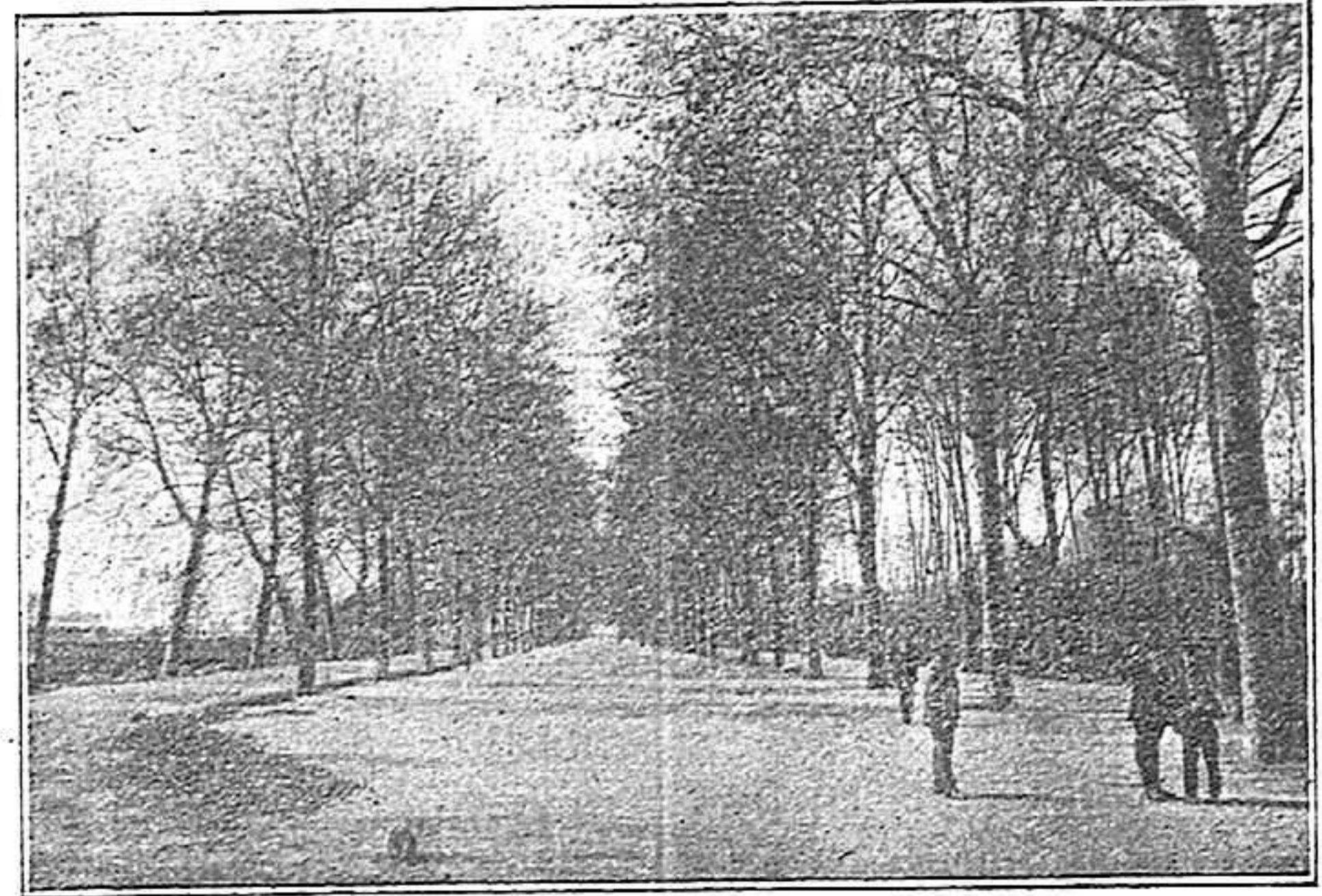
Paseo Central de la Dehesa

Esto en cuanto á los obreros musculares como los llama Bourdoux, el notable economista francés, quien dice que no hay mas diferencia entre ellos y nosotros los obreros intelectuales que la de los músculos y los nervios... Los que vivimos del trabajo somos todos obreros y compañeros y todos debemos apiñarnos, unirnos como un solo hombre y realizar la gran obra de la asociación española obrera para mejorar la clase