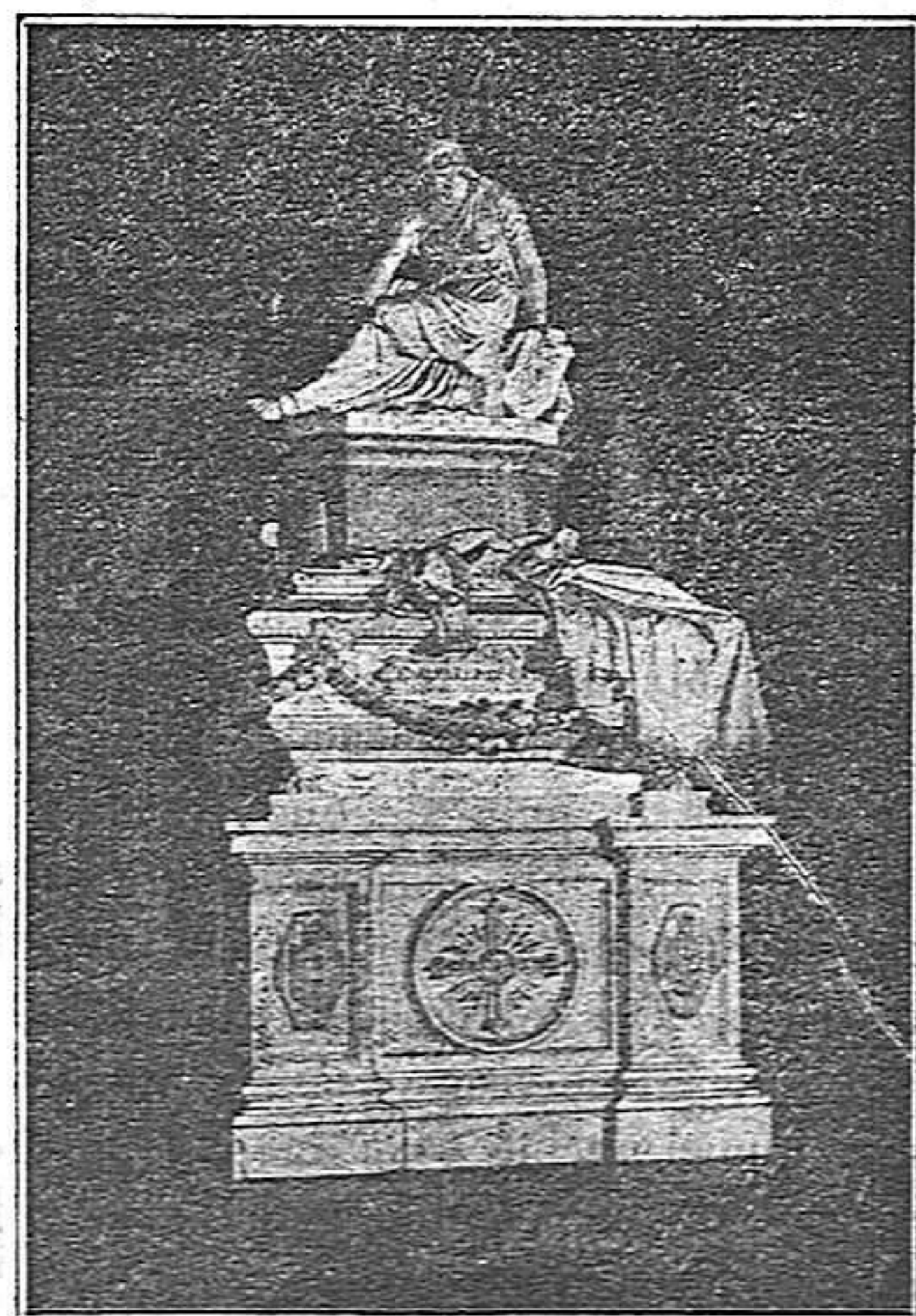
Sepulcro del general Alvarez de Castro