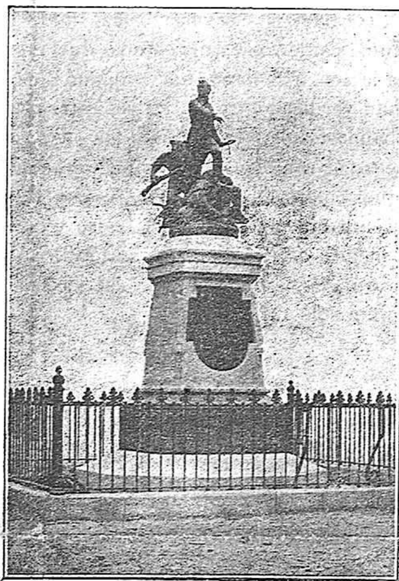
Monumento a los Mártires de Gerona

vida desahogada... Se apodera de todos el desaliento, cunde la hipocondría, el vacío se va haciendo en derredor de todos y asoma un espectro amenazador y terrible, el espectro del hambre que se pasea triunfante por poblaciones, ciudades y aldeas... En estas condiciones