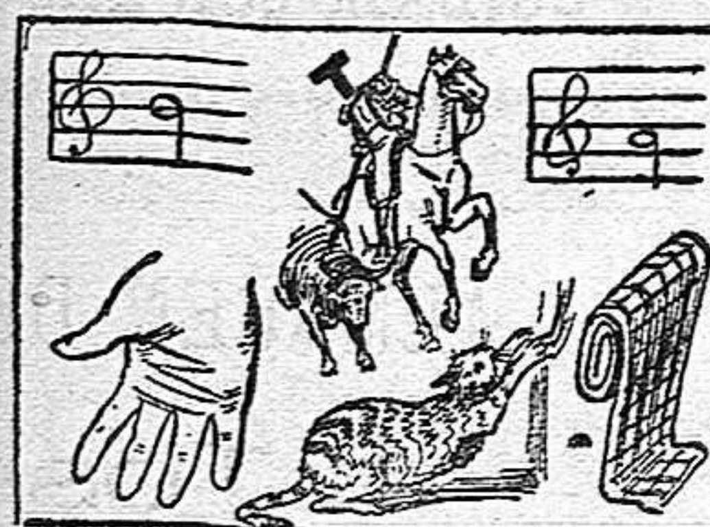
La solución en el próximo número.