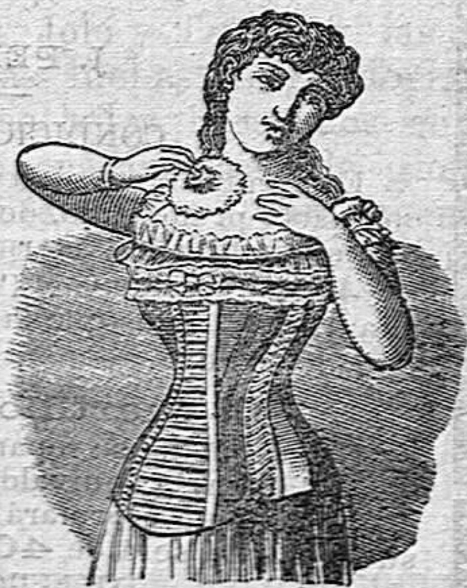
Confeccion de corsets á medida de todas las formas, precios y formas con ballones verdaderos.