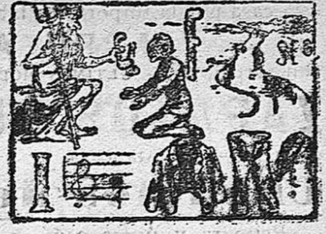
(La solución en el número próximo).