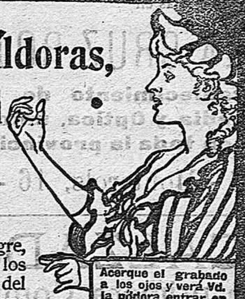
Acerque el grabado a los ojos y verá Vd. la píldora entrar en la boca.

DE VENTA EN LAS BOTICAS DEL MUNDO ENTERO.