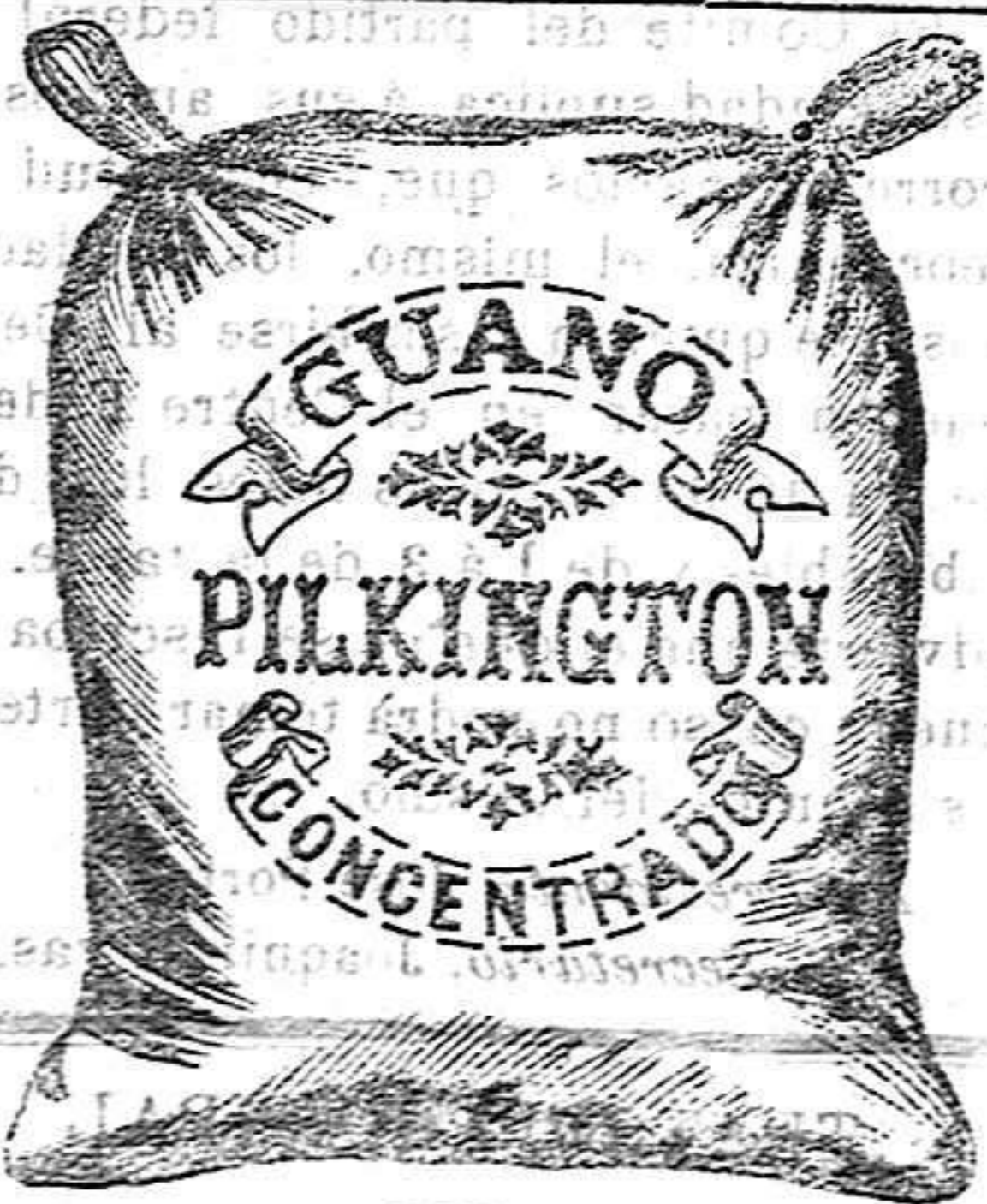
En las principales droguerías