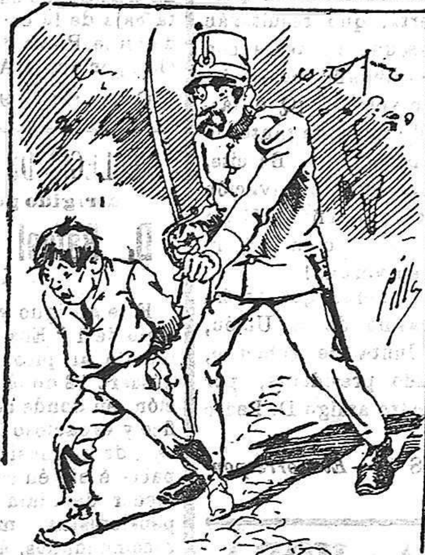
Tratamientos de la policía á nuestros vendedores cuando el número pica.....

lo desea en sobre dirigido al Sr. Administrador de