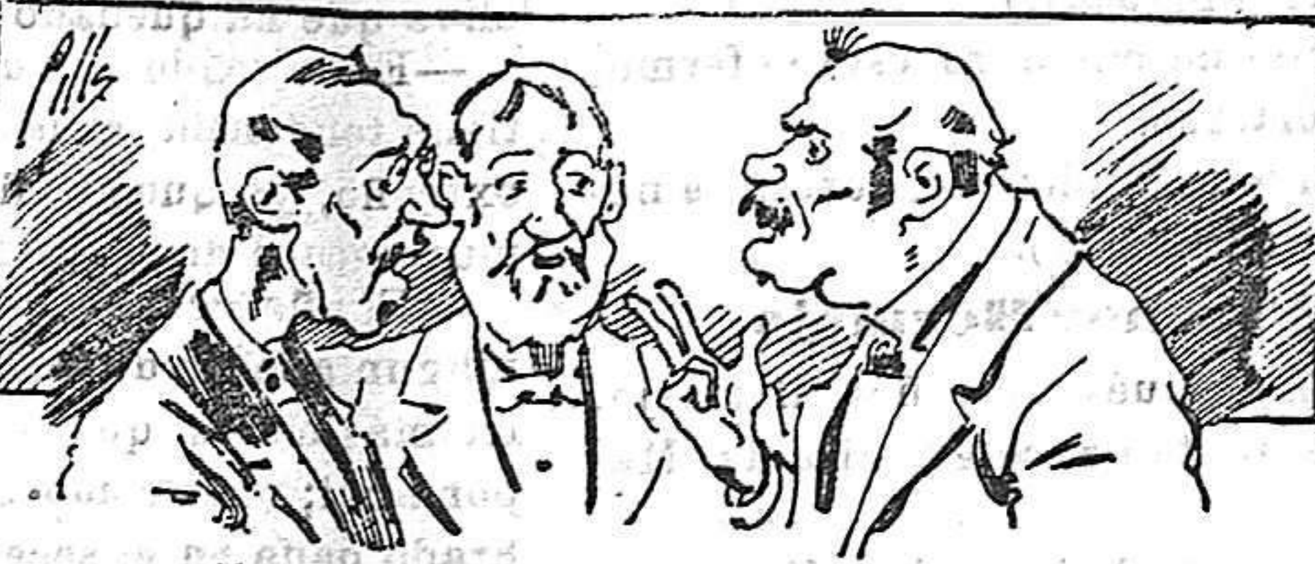
Abominan á nuestros libros....., pero los compran.

Todas las personas de gusto, curiosas é ilustradas deben pedir al Director de LA AVISPA, apartado núm. 8, MADRID, un ejemplar que se remite gratis y franqueado. Esta Revista Enciclopédica Popular publica recreaciones científicas, recetas de cocina, repostería, confitería, vinos, licores, pinturas, barnices, betunes y fórmulas para toda clase de industria, y cuantas noticias y conocimientos puedan ser beneficiosos. Cuenta además con buenos grabados, parte literaria excelente; da regalos mensuales á sus lectores con la Lotería Nacional y participaciones en la misma, á cuyo efecto compra todos los sorteos, y en una de las Administraciones más afortunadas por la suerte, billetes enteros. La suscripción y los números que se nos pidan se sirven gratuitamente á correo vuelto y franqueados, con sólo indicar el nombre y dirección del que lo desea en sobre dirigido al Sr. Administrador de