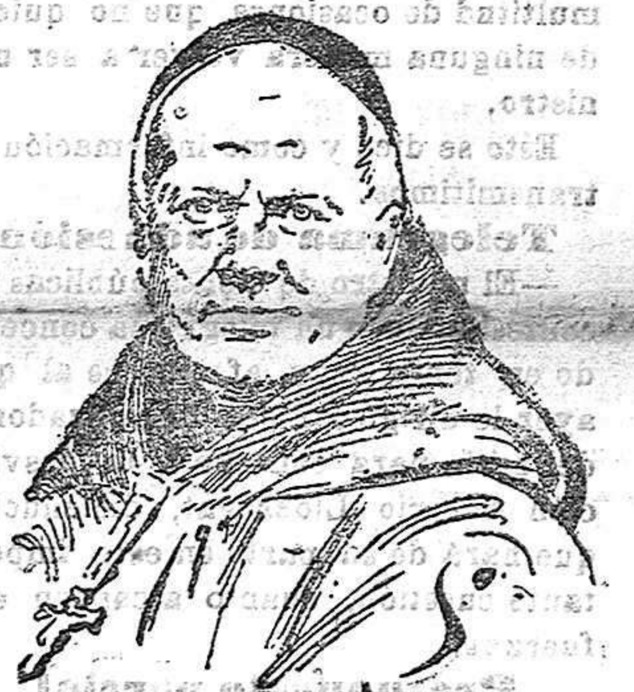
El Padre Gueranguier Abad de Solesmes