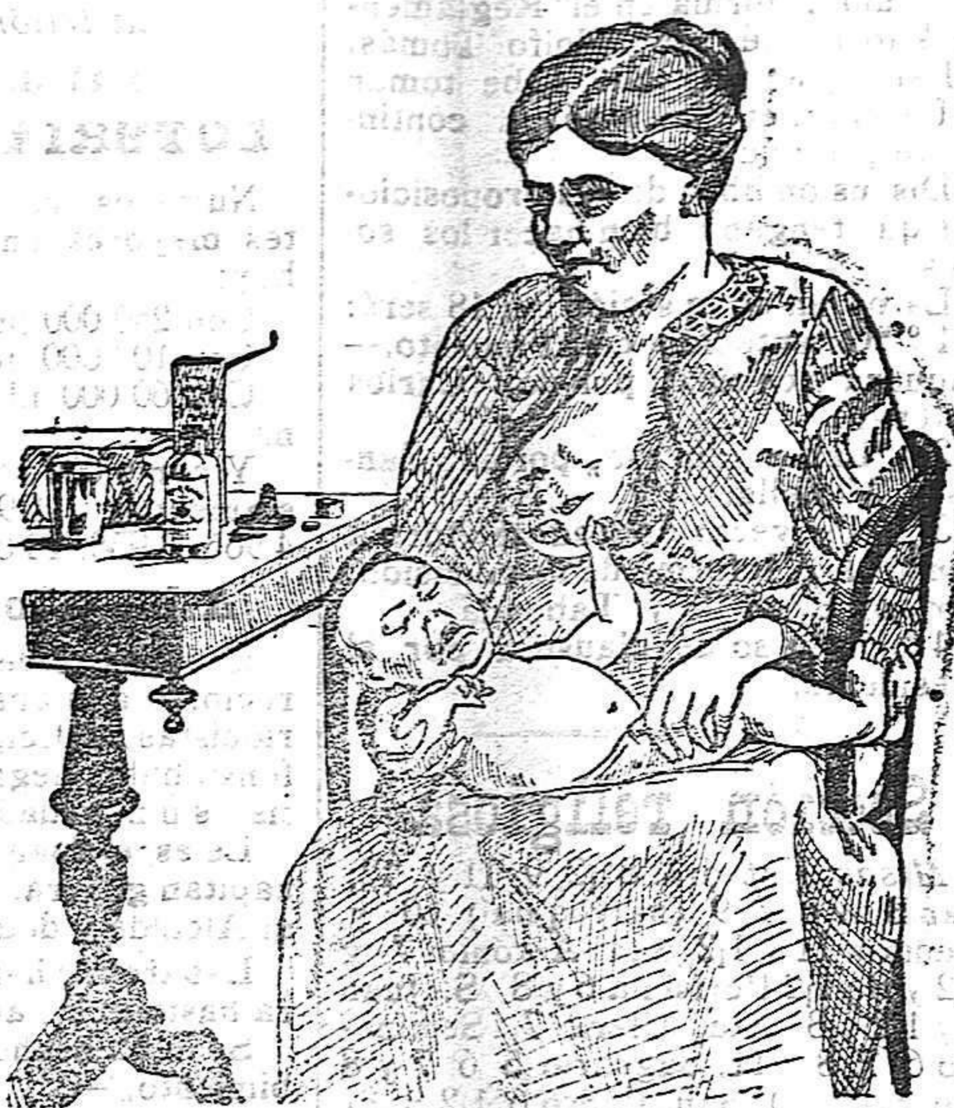
La que no hizo caso del Salverol