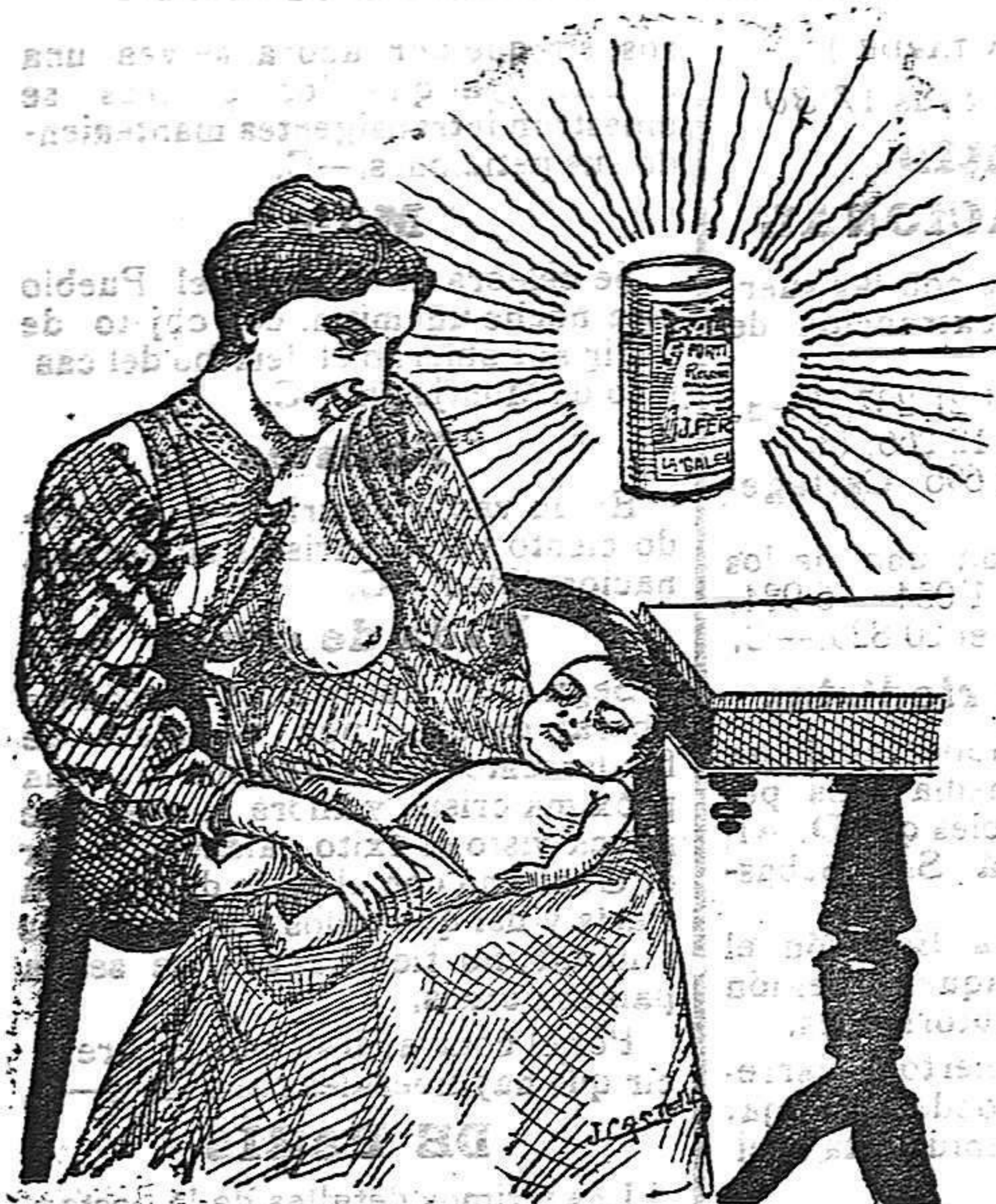
La que hizo caso del Salverol

Depósito general S. J. A. del Salverol en Santa Bárbara (Tarragona)