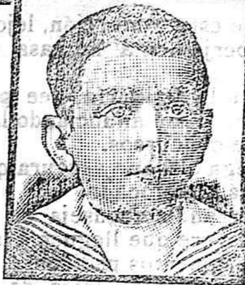
Madrid, Calle del Pez 6, 25 Febrero 1909.