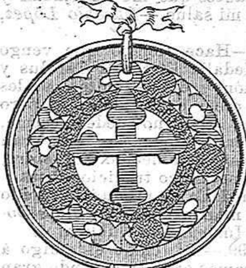
Dibujo y tamaño natural de la Medalla

Muchas personas escriben para conocer el tiempo necesario para la curación de sus dolencias; como se verá en las certificaciones que publicamos, algunos casos crónicos han sido curados á las veinticuatro horas, otros necesitan semanas y meses para su curación, y más especialmente cuando la enfermedad está profundamente establecida. La sangre y el sistema nervioso en general son afectados en algunas personas más rápidamente que en otras, por medio de la corriente electro-magnética; por consiguiente su curación, casi siempre segura, necesita más ó menos tiempo según la DEBILIDAD GENERAL del sistema nervioso.