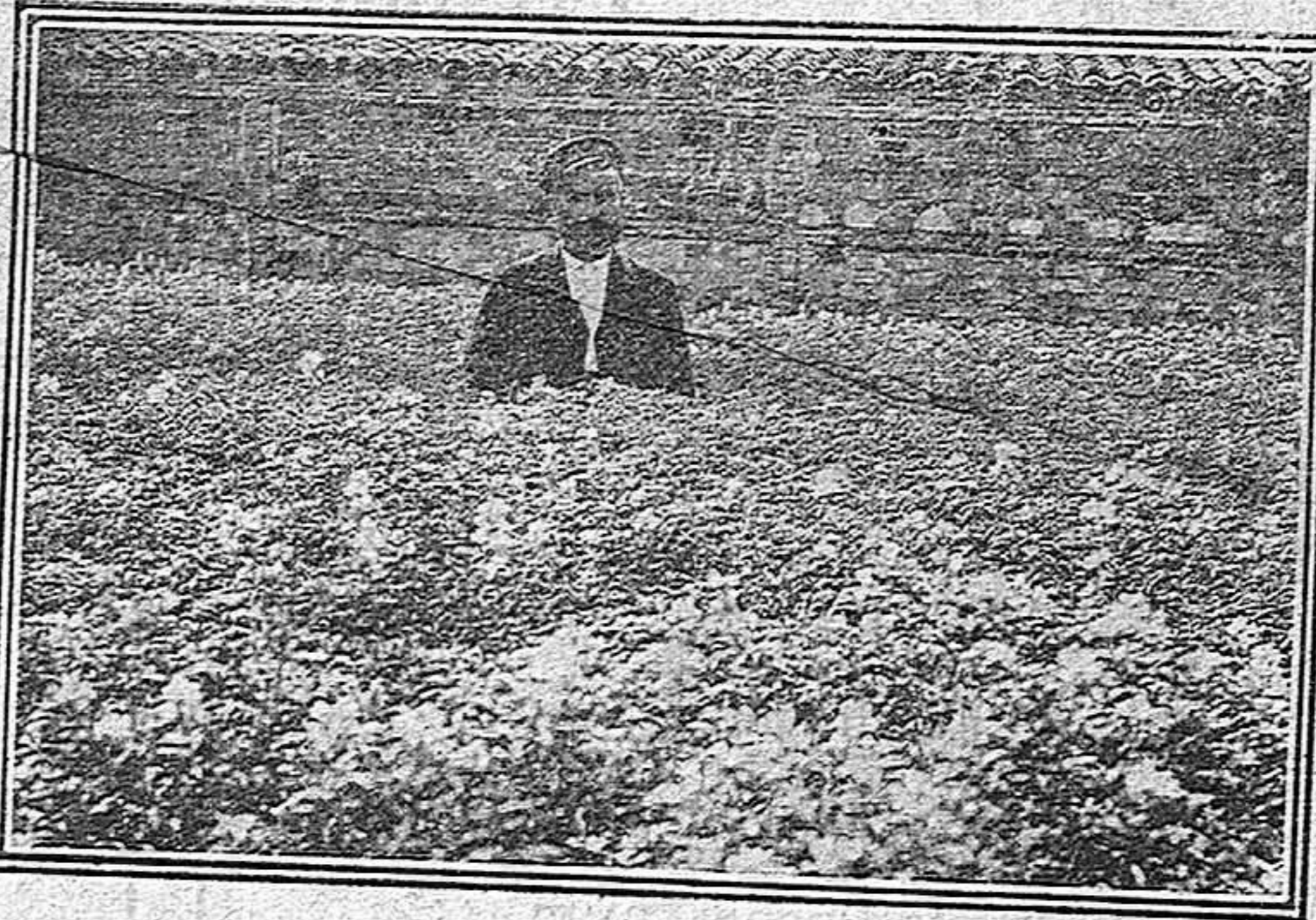
2.ª parcela: abonada con 600 kgs. de escorias Thomas por hectárea. Produjo 3.000 kgs. de grano por hectárea.

Como vemos, el altramuz en nuestro país, pobre de estiércoles, está destinado á ser una planta cuyo cultivo se ha de extender de día en día, pues aparte de las otras aplicaciones de que hemos hablado, enterrado como abono verde, suple una fuerte estercoladura, pues su producto por hectárea equivale á una cantidad de 35 á 55.000 kilogramos de estiércol.