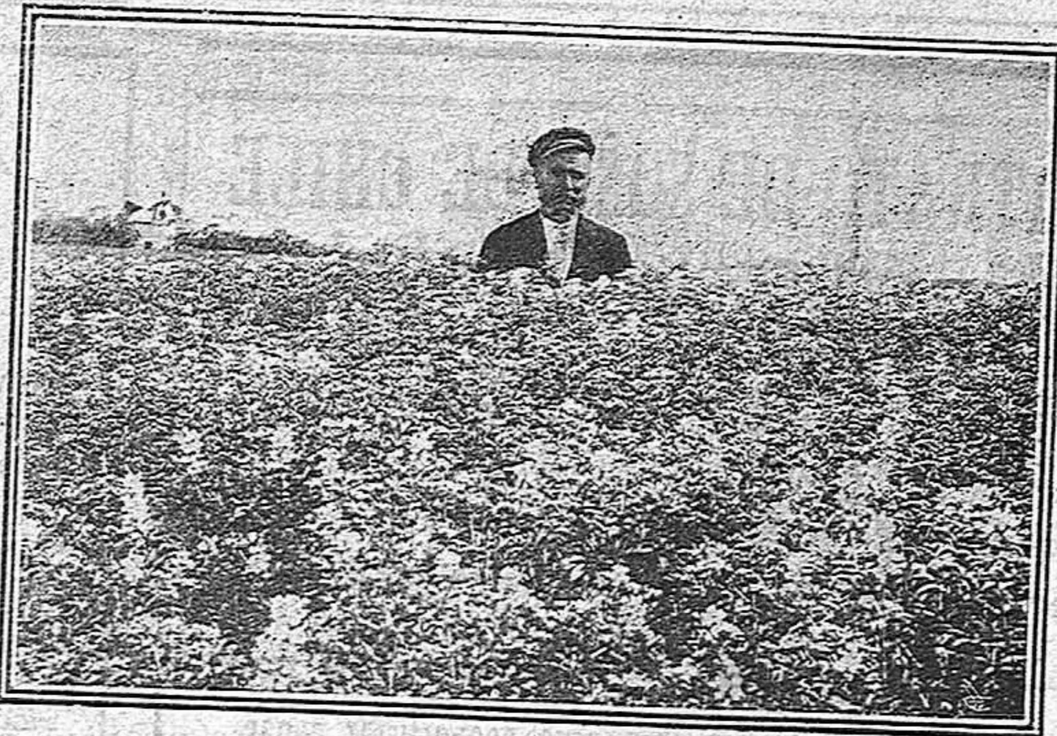
3.ª parcela: abonada con 600 kgs. de escorias Tomás y 300 de Kainita por hectárea. Produjo 3.320 kgs. por hectárea.