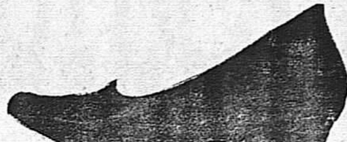
Señora, 5'50 pest.