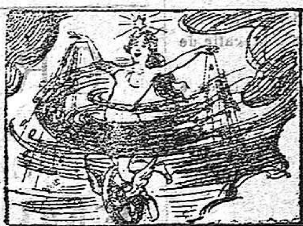
Solución a la anterior: Sin piés ni cabeza.