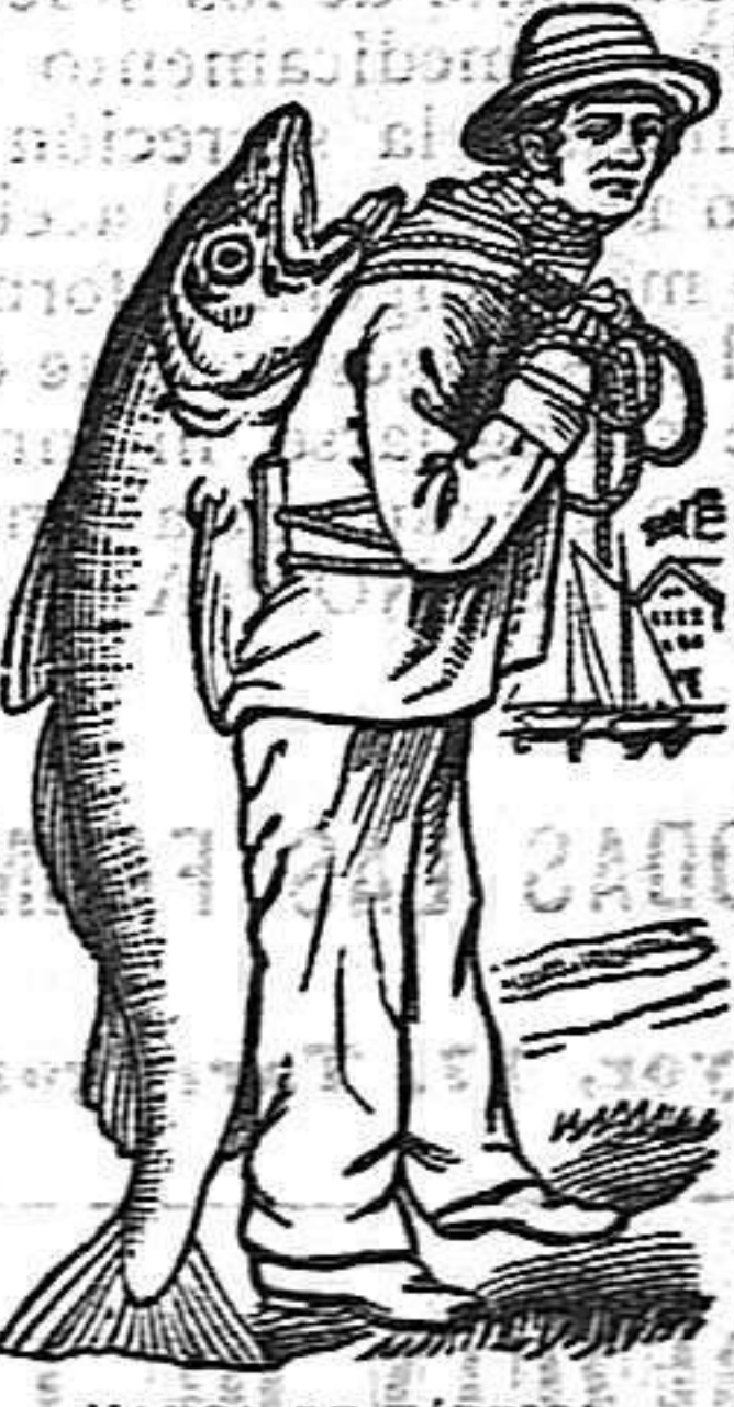
MANCA DE FABRICA

Ninguna otra preparación en el mundo puede igualarse á la Emulsión Scott ni producir tan benéficos resultados. A ningún médico se le ocurrirá ordenar á sus pacientes el aceite de hígado de bacalao en estado natural, sabiendo cómo es fácil reconocer la Emulsión Scott y que en ella se halla el aceite en estado predigerido, y por consiguiente que no requiere del estómago trabajo alguno de digestión. Es de suma importancia que el público pida siempre la legítima Emulsión Scott, la que se conoce por la marca de fábrica (en el envoltorio exterior de cada frasco) representando un hombre que lleva á cuestas un gran bacalao.