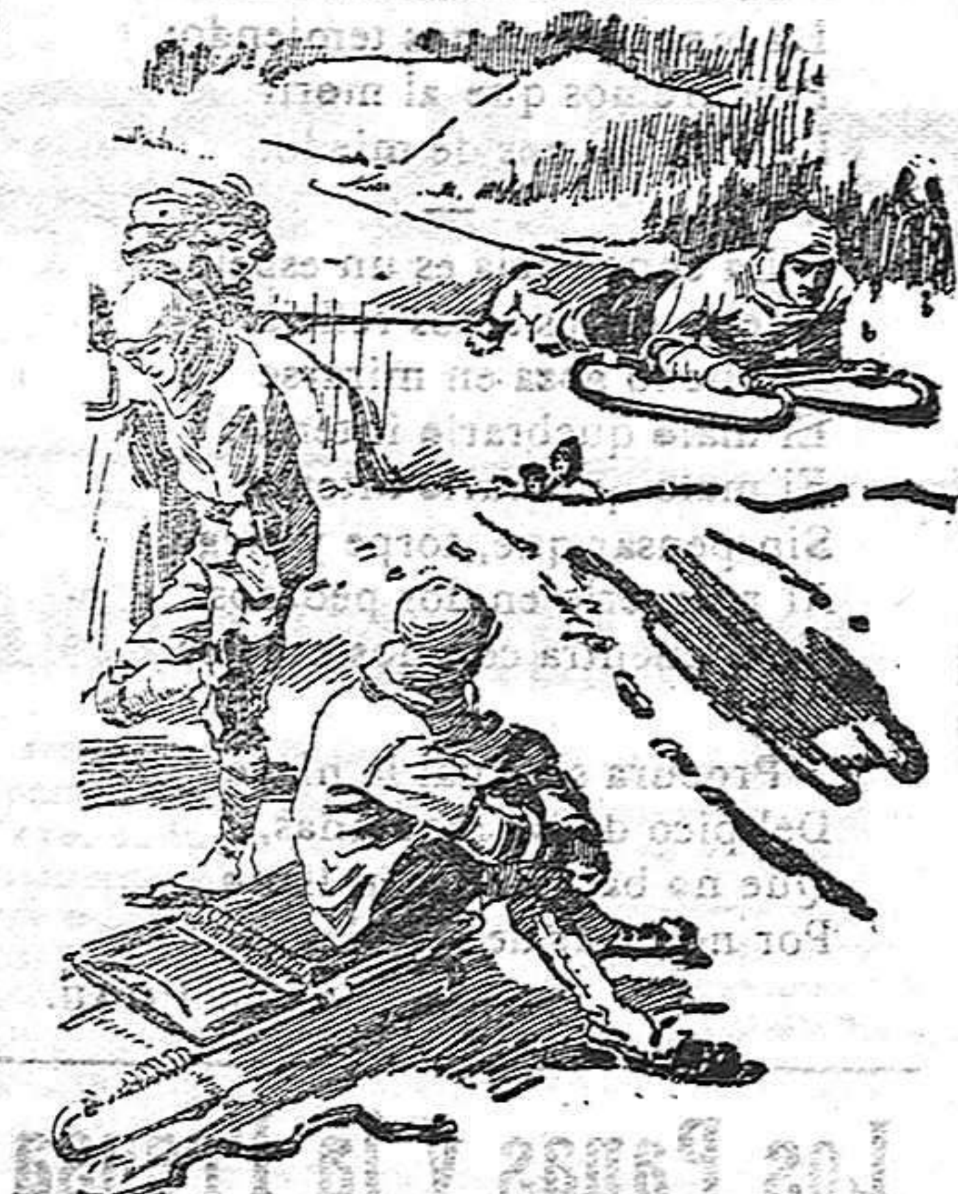
Un buen salto de tobogan

Las escusiones y las carreras en skis constituyen la principal distracción de