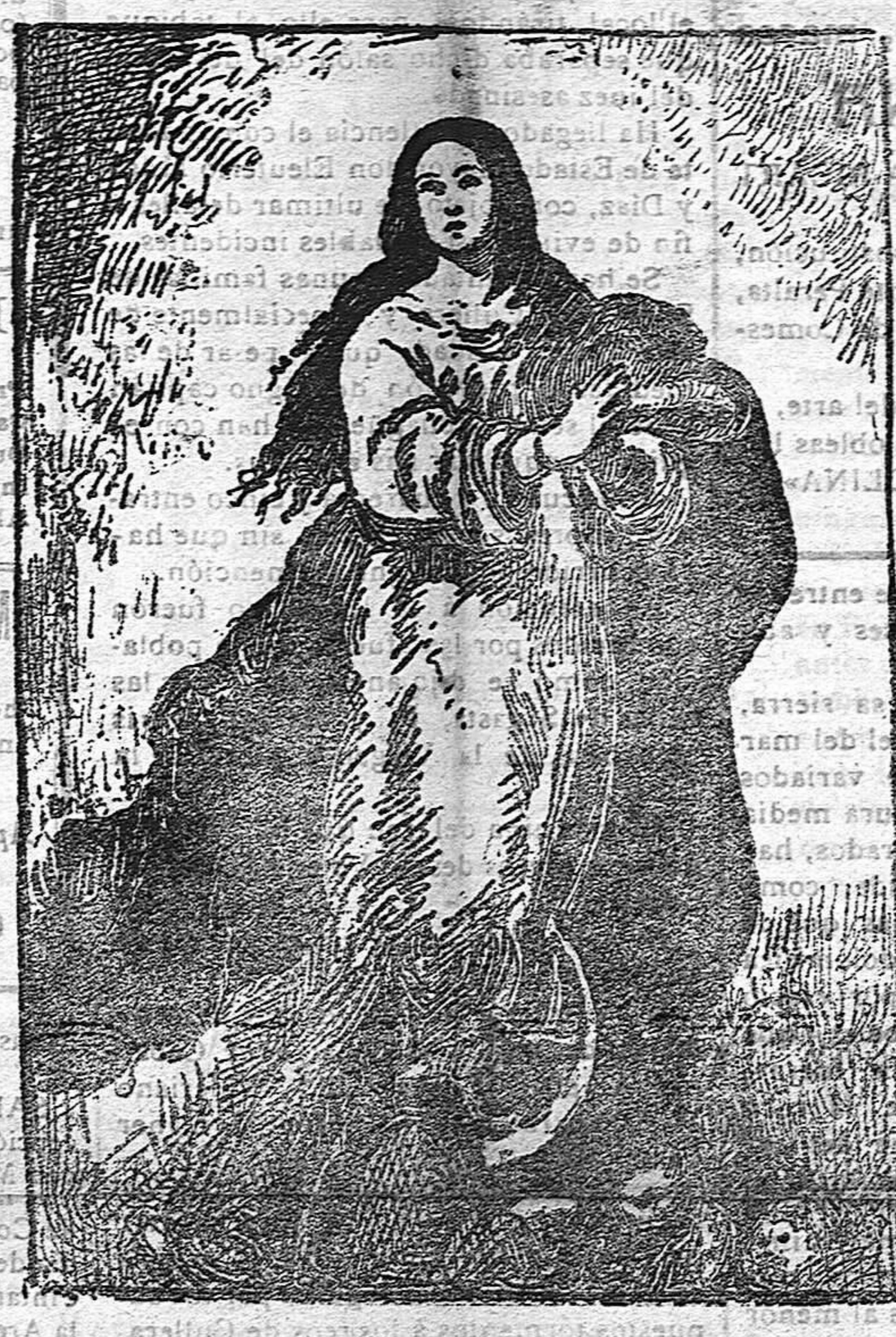
¡Sine labe concepta!