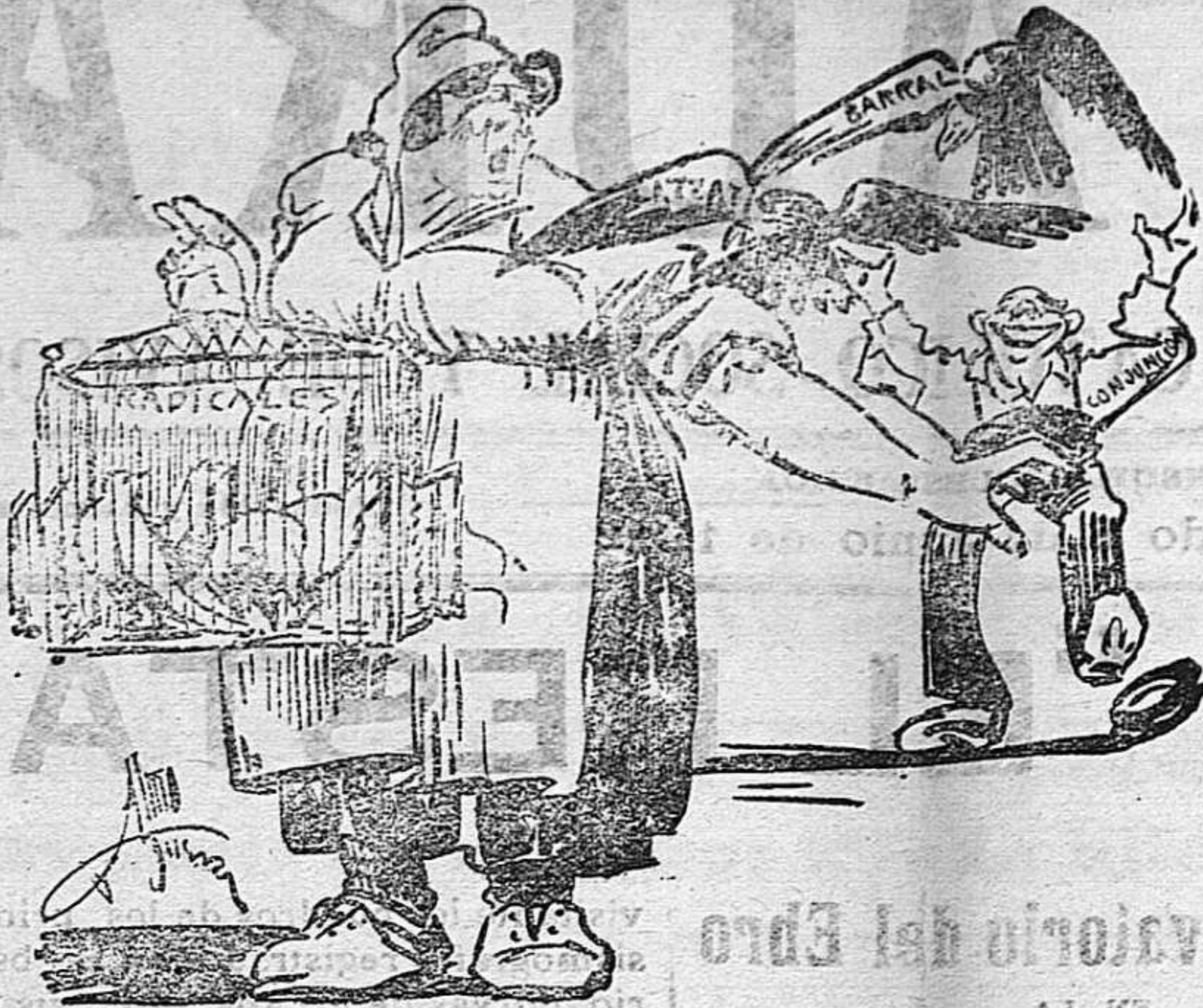
ELLA.—¡Ay que se me escapan! Pues como los llegue a coger ese golfo jadiós mi cartel'ol!

XXXVI La justicia se representa en una balanza... Acumulemos en un platillo alanzas sin cuento á nuestro Dios, no sea caso que en el otro platillo se aglomeren tantas blasfemias que venzan en su peso. XXXVII Esposas: ¿Queréis conquistar un gran mérito ante Dios?; borrad la blasfemia de vuestras casas, pues si os empeñáis como lo sabéis hacer, el triunfo es vuestro y la victoria segura. XXXVIII El que en público y en privado no descansa en desterrar la blasfemia, se acredita de ser buen soldado de Dios. XXXIX El que blasfema al recibir un contra-tiempo, es un necio, pues pretende apagar el fuego atizándolo. XL El que bendice á Dios en la adversidad, es un sabio, porque confía y espera en Aquel que todo lo puede. Si en tal caso blasfema, es inconsecuente. XLI Las palabras que se emplean para blasfemar indican lo inmundicia que es la blasfemia, y convierten la boca que las profiere en una letrina. JULIO CHILIDA MELIÁ.