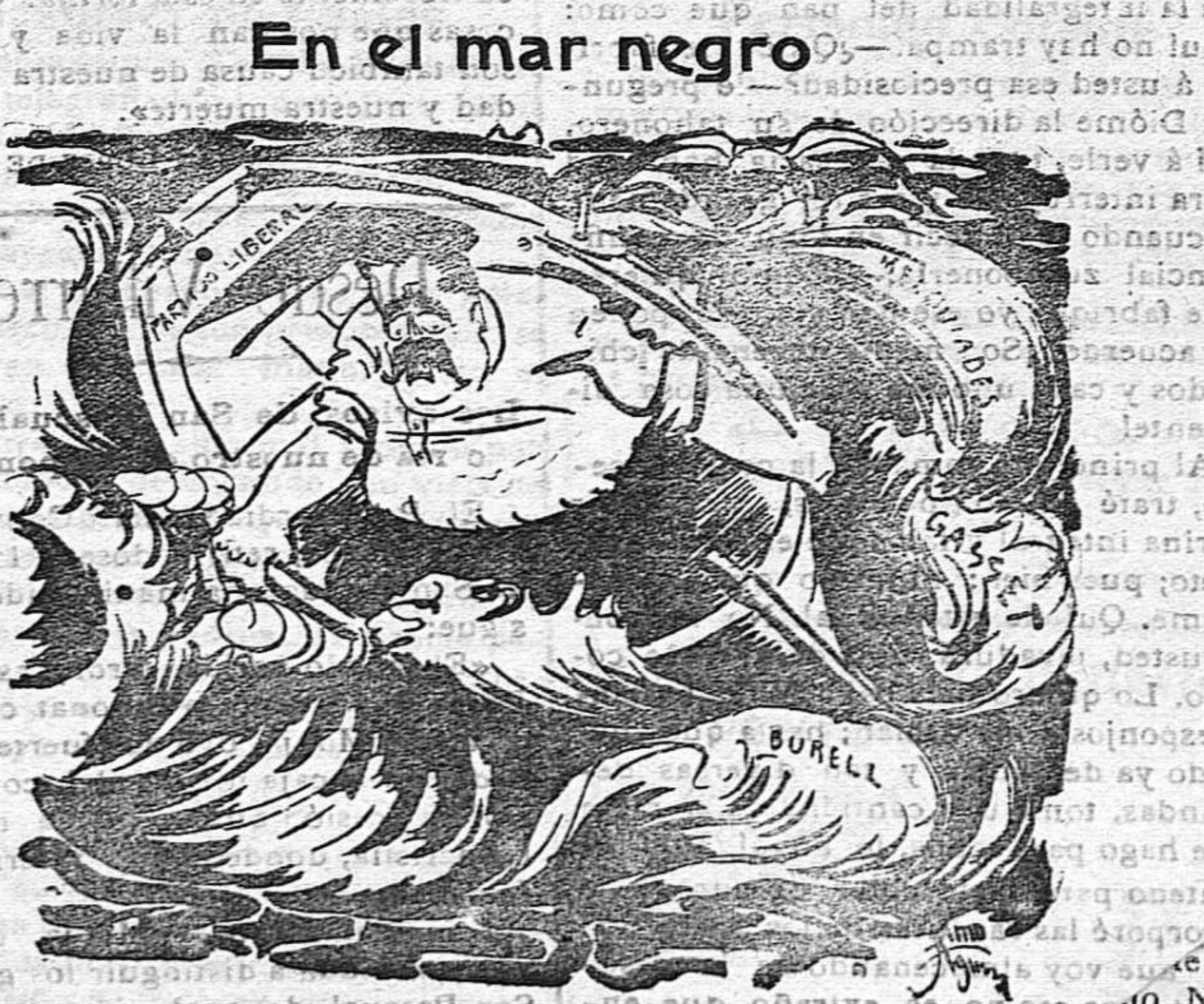
En el mar negro