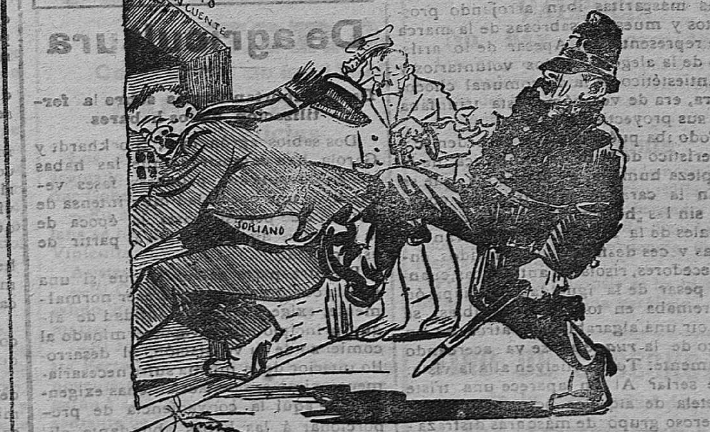
EL GUARDIA.—Ande pa dentro gandul. SORIANO.—¡Guardia, modérese, que soy diputado! EL CARCELERO.—Pase S. S.!