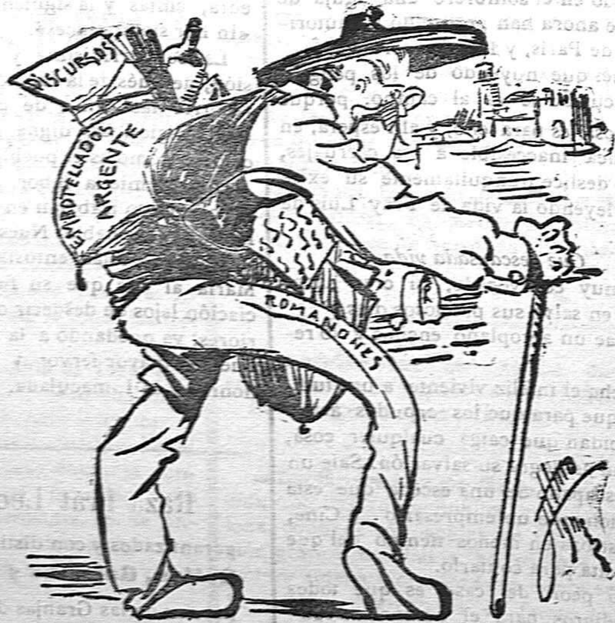
Para estos viajes he menester alforjas.