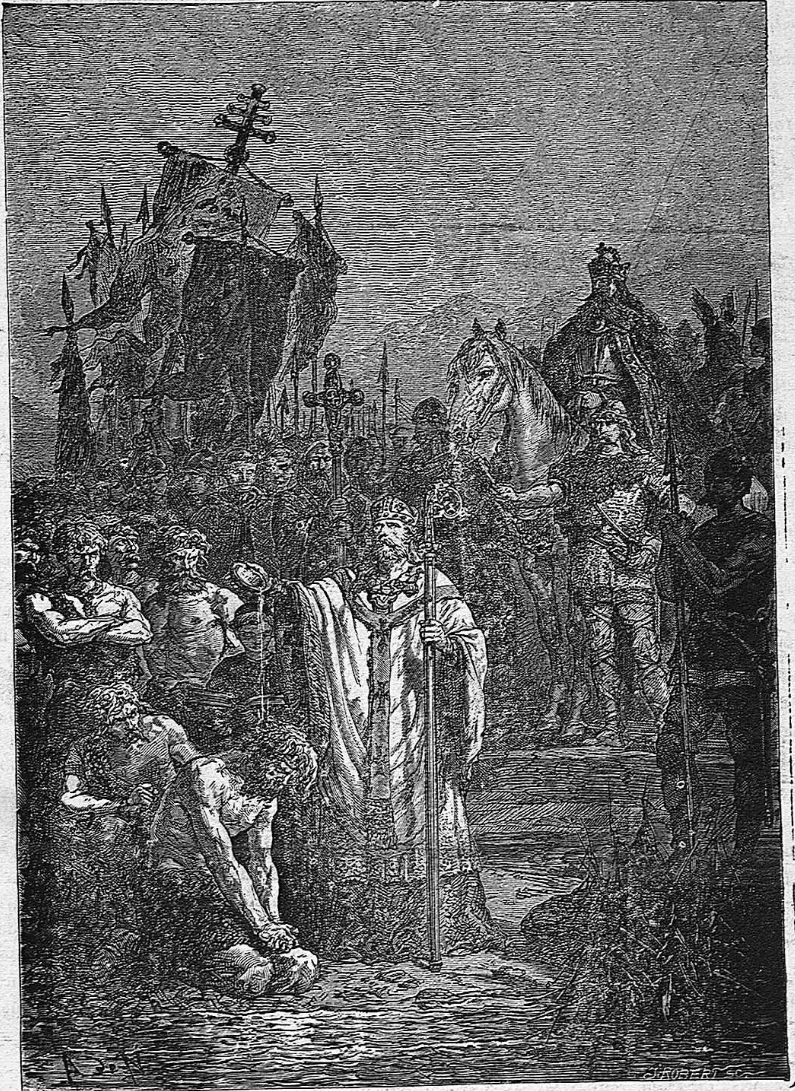
IMPOSICION DEL BAUTISMO A LOS SAJONES.