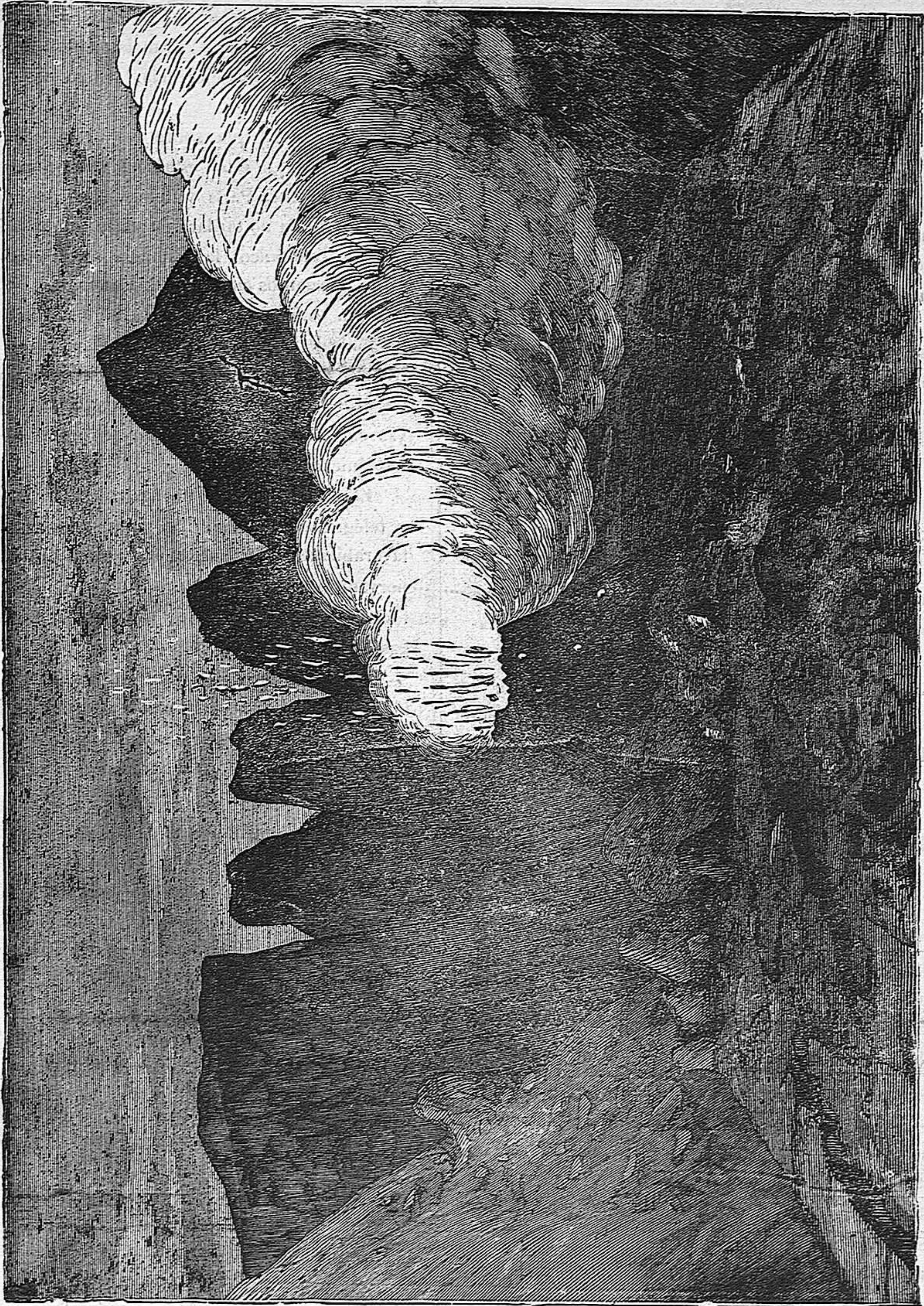
EL CRATER DEL VESUBIO.