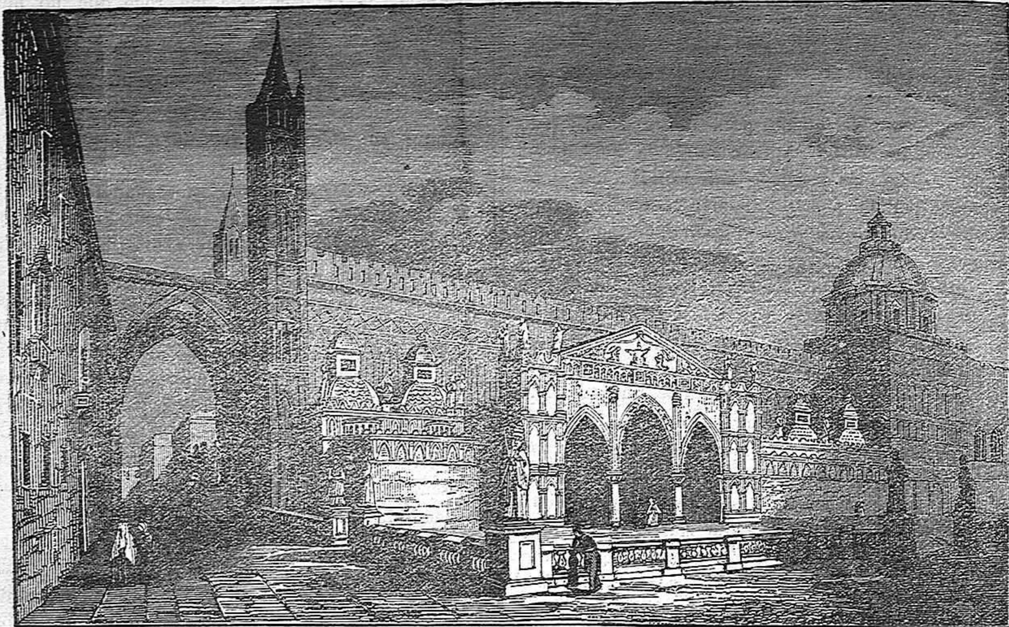
CATEDRAL DE PALERMO.

nuestro camino, y también añadí que al volver á Barcelona haría todo lo posible para encontrar á V. y pedirle su amistad.