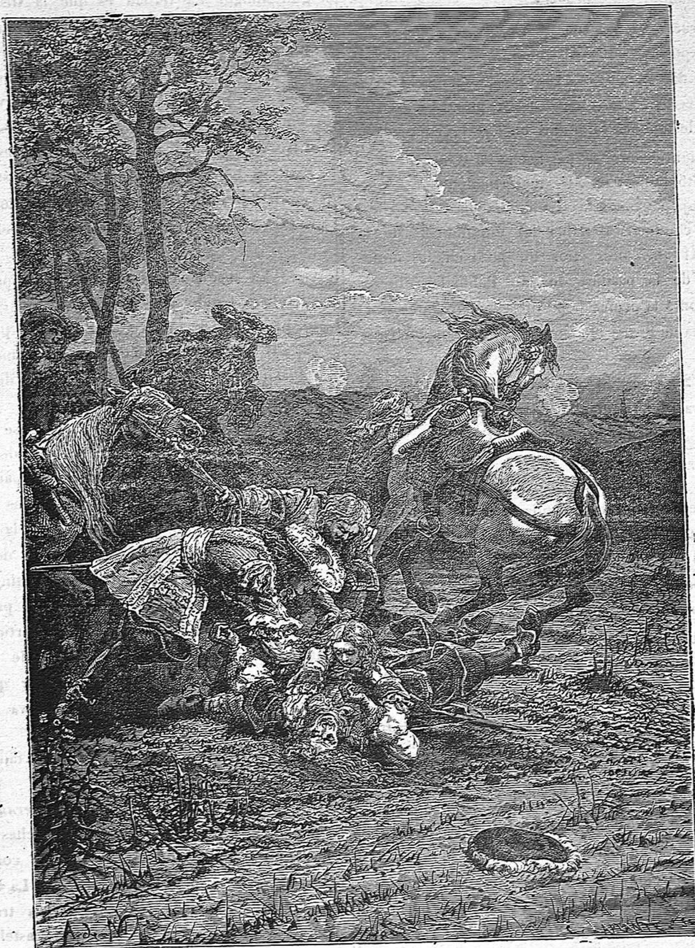
MUERTE DE TURENA.