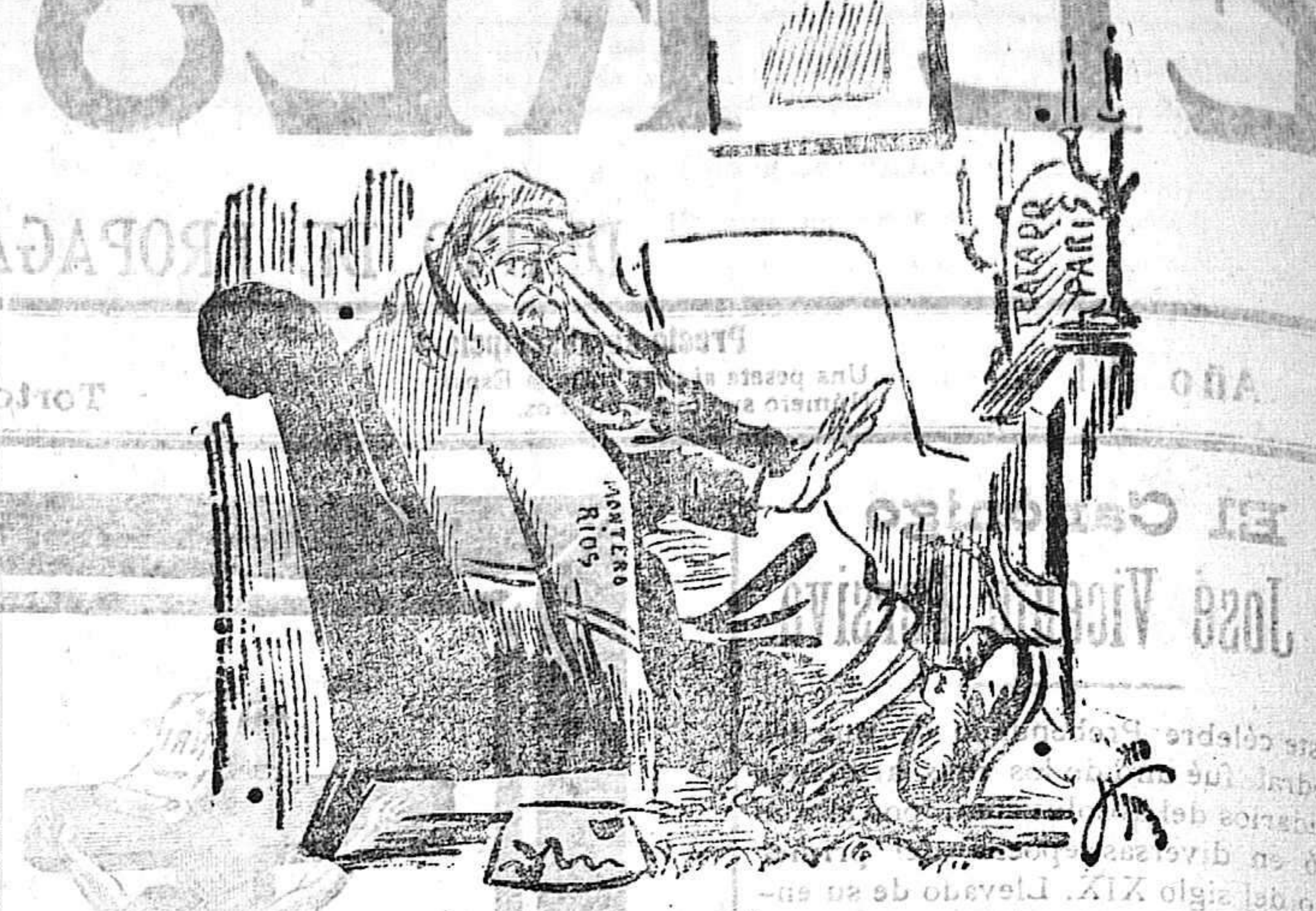
¡Lástima de presidencia del Congreso! ¡Qué ocasión se me ha ido de las manos por no tener otro yerno!

PARROQUIA DE SAN VICENTE.—Misas rezadas a las 6, 7 y 11:2 y 9. Por la tarde a las 2 Catecismo y Rosario. SAN ANTONIO.—Misas rezadas a las 7 y 8 y 11:2. SAN PEDRO.—Misa rezada a las 6. SANGRE.—7 y 10. SAN JOSE.—Misa rezada a las 7. SIERVAS DE JESUS.—A las 7 y 8. SAN JUAN.—A las 7 y 11:2 Misa cantada con Exposición de S. D. M.; y por la tarde a las 4 y 11:2. PURÍSIMA.—Misas rezadas a las 5 y 11:2 y 9. Por la tarde a las 2 y 11:2 solemnes Vísperas con Exposición de S. D. M. SANTA CLARA.—Misa rezada a las 6 y 11:2. La solemne a las 7 y 11:2 con Exposición de S. D. M. Por la tarde, Vísperas solemnes con Exposición. COLEGIO DE LOS HERMANOS DE LA DOCTRINA CRISTIANA.—Misa rezada a las 8. REPARACION.—Misas rezadas a las 5 y 11:2, 6 y 7 y 11:2. Por la mañana, la Exposición empieza a las 6, la bendición y reserva a las 8. Por la tarde a las 5 y Exposición, Rosario a las 6 y 11:2; bendición y reserva a las 7.