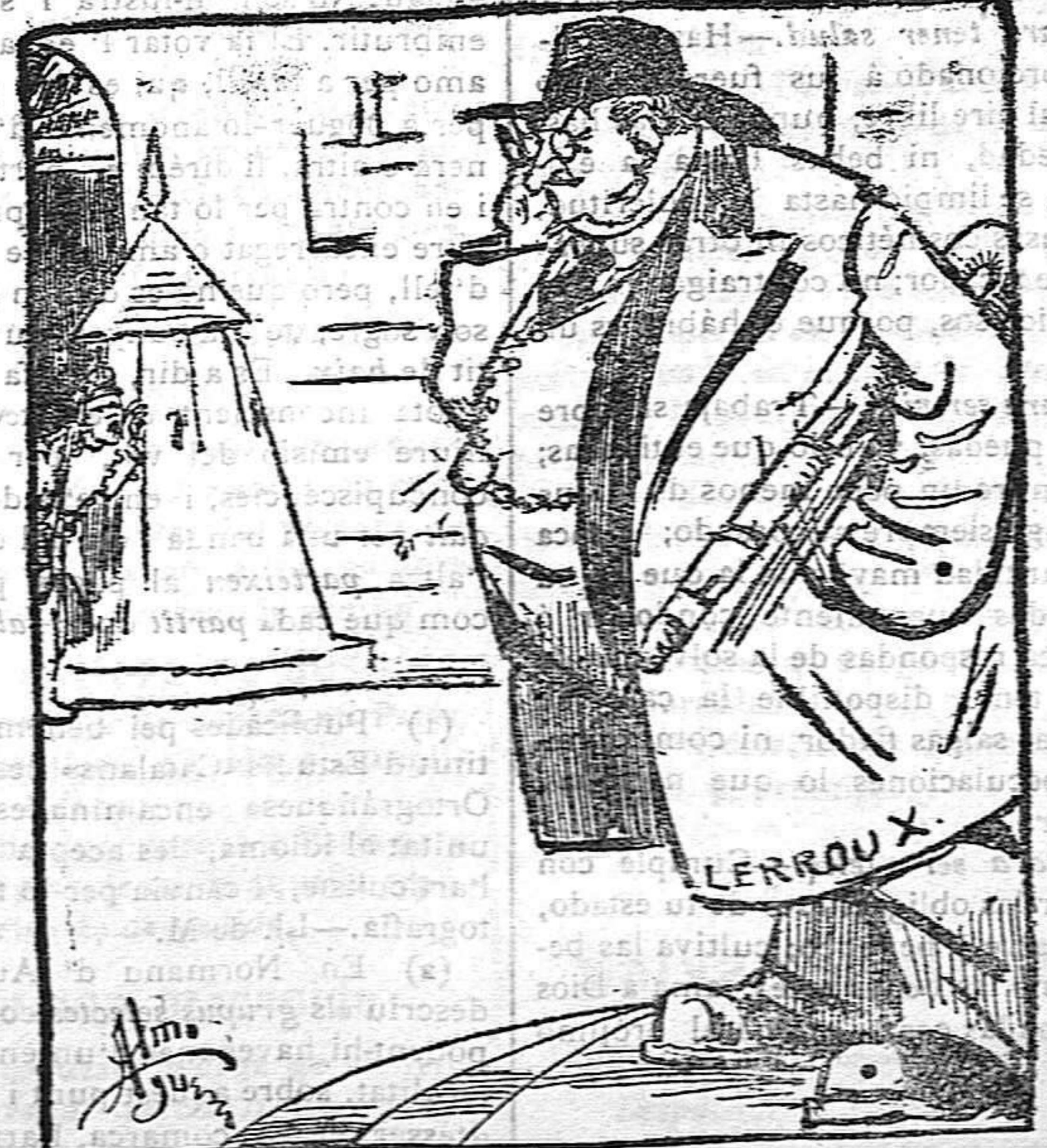
El soldado... ¡Gen inela, alertaaa! Lerroux.—¿Me habrán llamado?