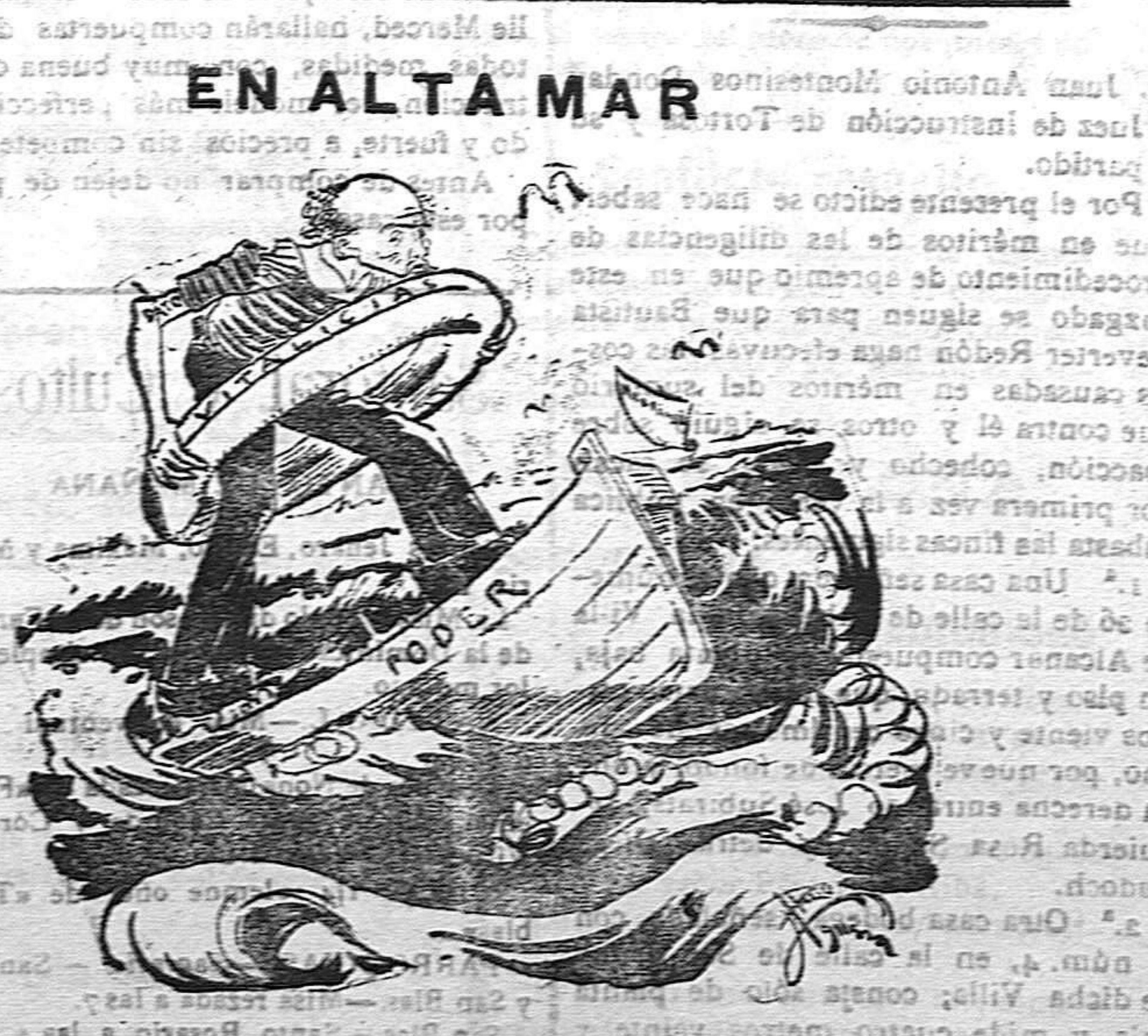
Zozobramos, pero este sa'yavidas me saca a una orilla.

En Barcelona, afortunadamente, abundan las obras e instituciones sociales, y