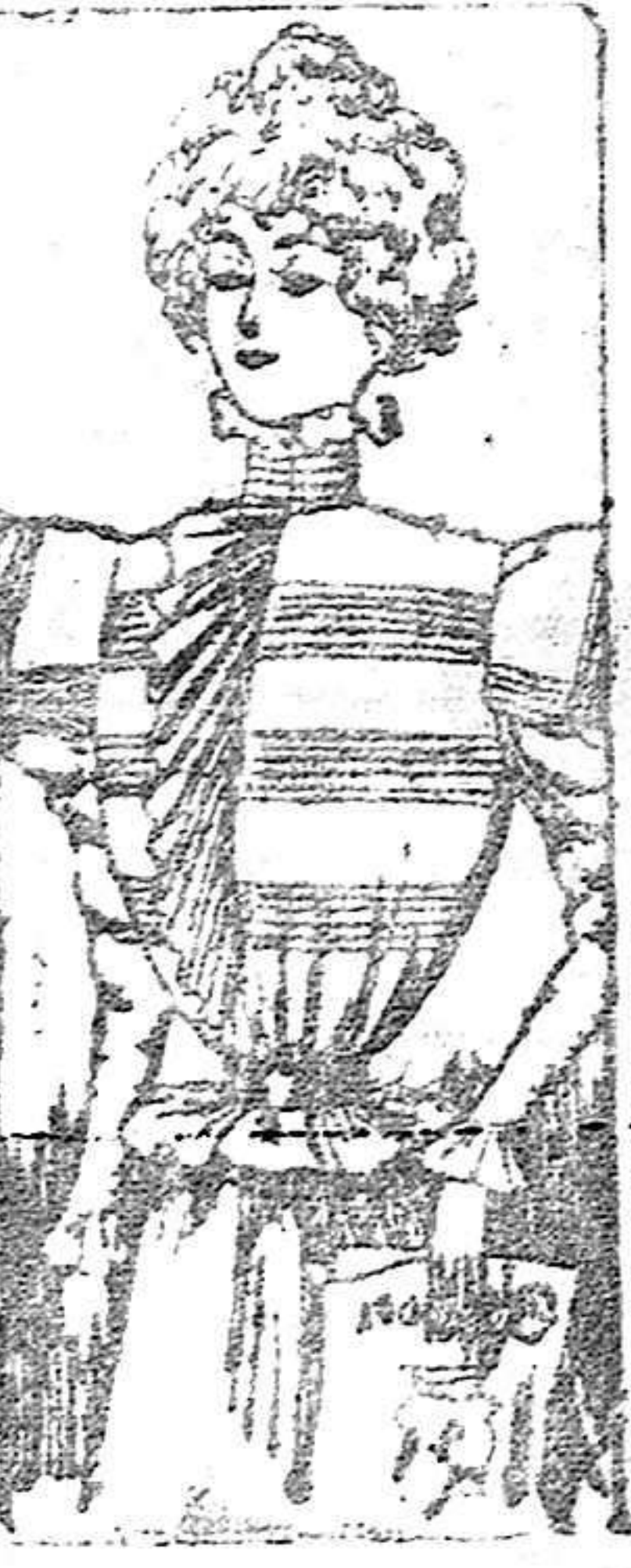
Bellas para verano