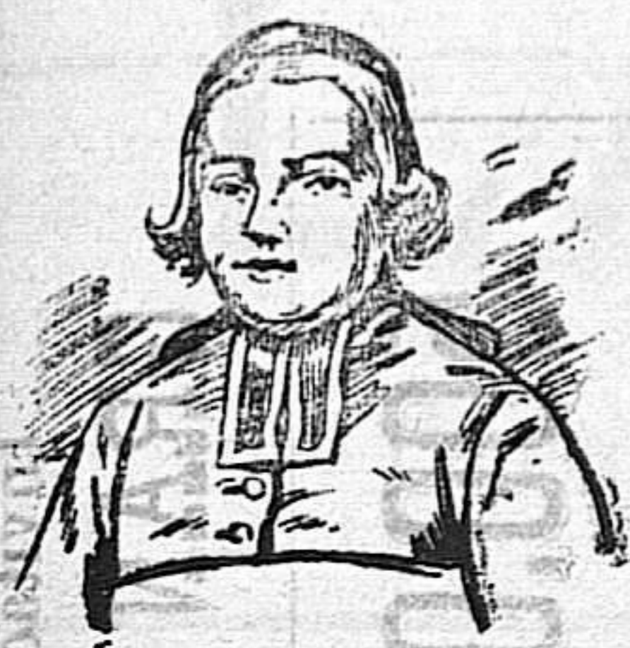
Carlos Miguel L'Épée