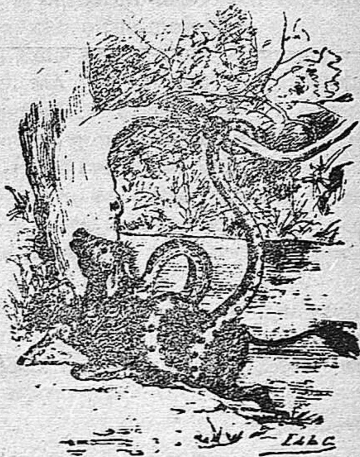
El «socoruyuba» ó boa acuática