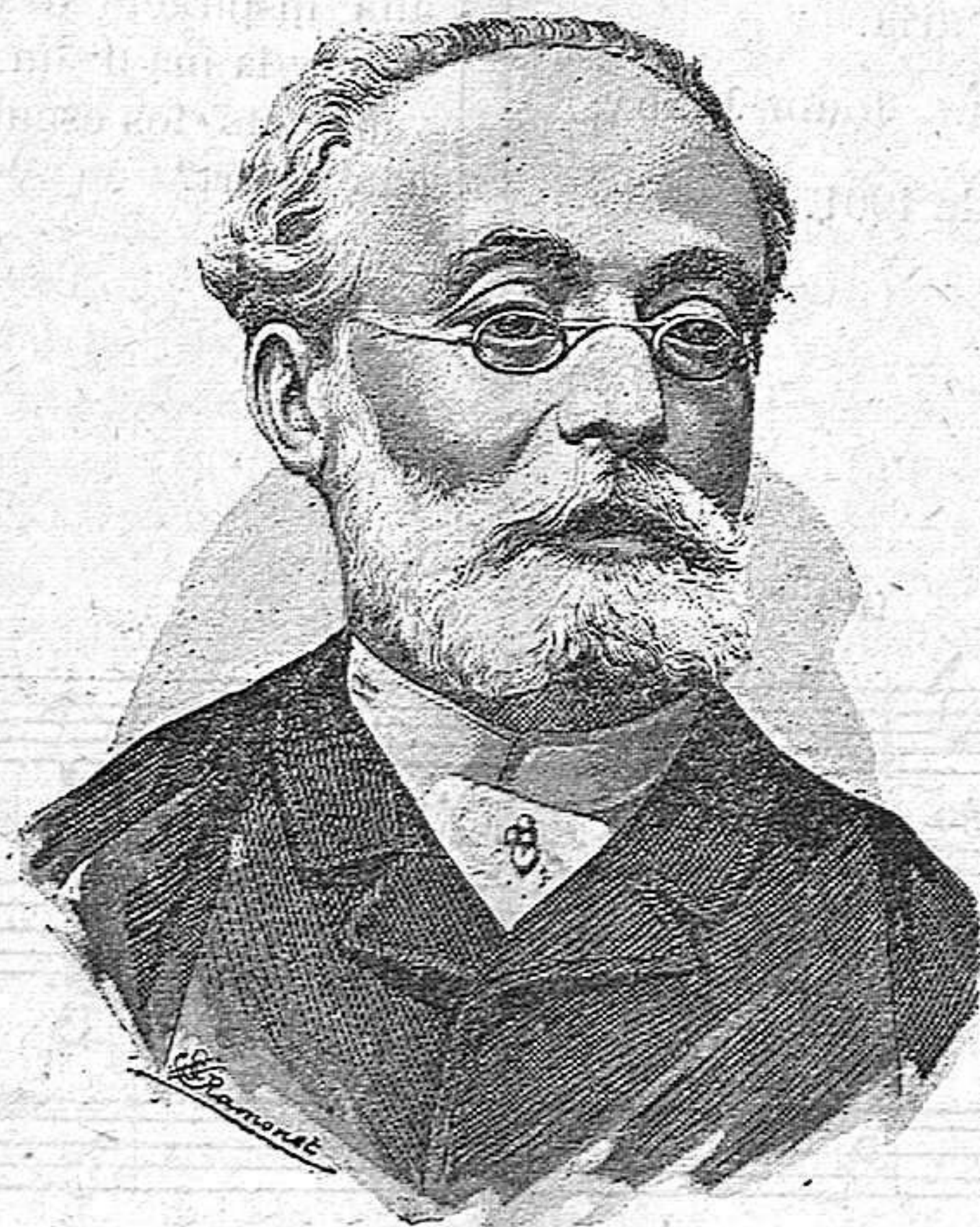
D. FELIP PEDRELL

Mentres aixó passava, y Gerona se resistia assetjada pel francès, arribaren á les nostres platges els estols de baixells comandats pel campió de la mar en Roger de Lluria, els quals, aplegats