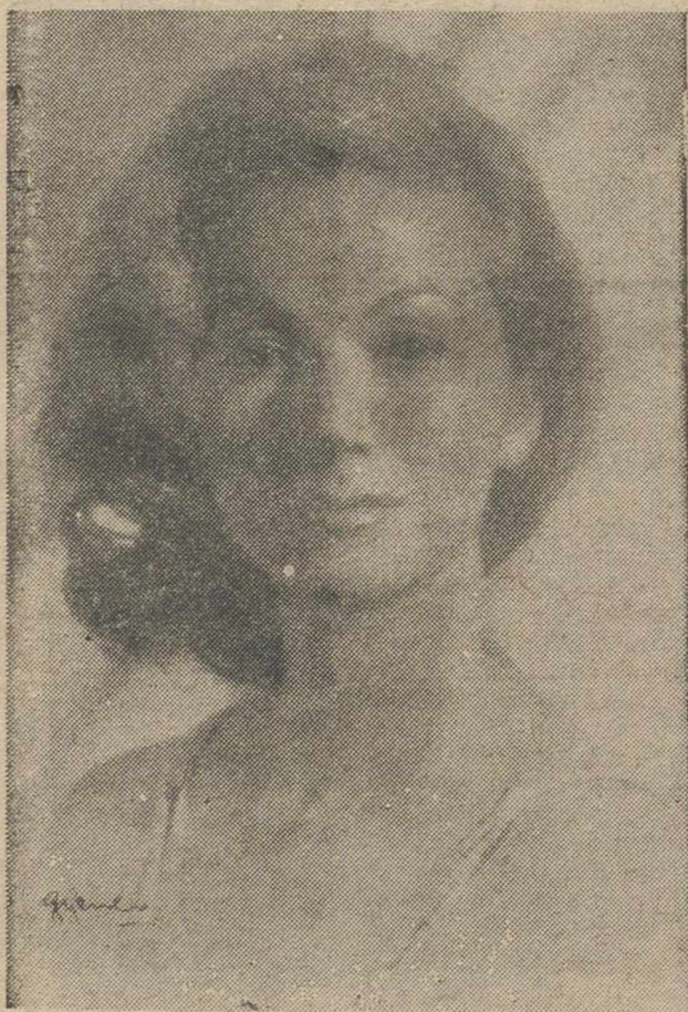
Carmen de la Maza

El próximo día 21 debutará en nuestra ciudad la compañía "Retablo" que con Carmen de la Maza como primera actriz pondrá en escena la obra "El Castigo sin venganza", de Lope de Vega, "la más alta tragedia del genial dramaturgo", al decir de Menéndez Pidal. Esta obra también titulada "Cuando Lope quiere, quiere" es sin duda la más importante del "gran monstruo de la naturaleza". Por versi-