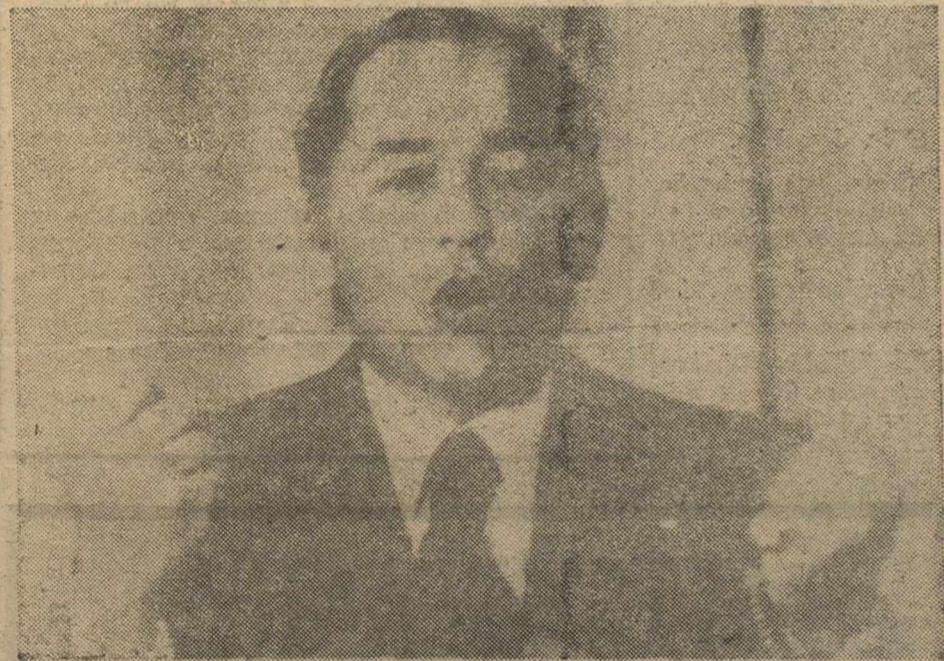
AGADIR (Marruecos).—El rey Hassan II, de Marruecos, ordena a los participantes en la "marcha verde", que vuelvan a Tarfaya, durante un discurso dirigido al país, a través de la TV.

El Decreto está firmado por Juan Carlos de Borbón, Príncipe de España, y la decisión de cese corresponde a la reunión del Consejo de Ministros del día 10 de octubre de 1975. — Cifra.