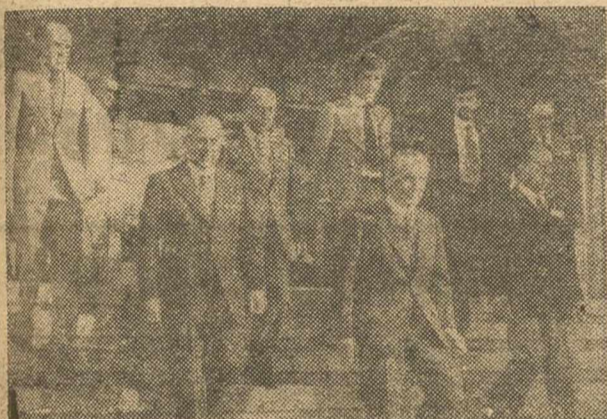
MADRID.—El presidente del Gobierno, don Carlos Arias, acompañado por los ministros de la Presidencia, Vivienda y Asuntos Exteriores, sale de la Ciudad Sanitaria "La Paz", tras interesarse por la salud del Jefe del Estado.