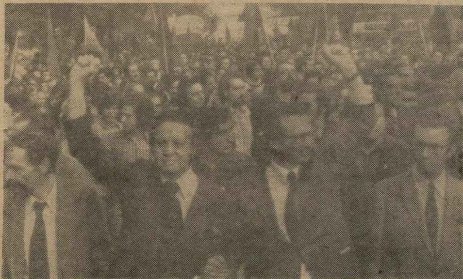
LISBOA.—El líder socialista, Mário Soares, cogido del brazo del ministro de Justicia, Francisco Zenha, encabezan la gran manifestación socialista que ha tenido lugar en Lisboa.—.