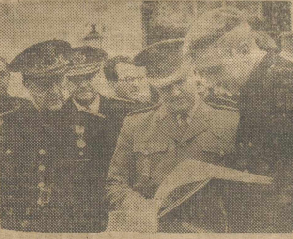
El Frente de Juventudes, obra predilecta de nuestro régimen, encuentra siempre los brazos abiertos del Caudillo. En la foto, el delegado nacional del Frente de Juventudes muestra a Franco la memoria de un Consejo, en presencia del ministro secretario.