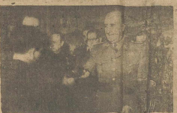
Los aprendices merecen especial atención del Estado, porque en ellos está el futuro laboral de la Patria. El acto de la entrega de premios por el Caudillo ha sido recogido en esta foto.