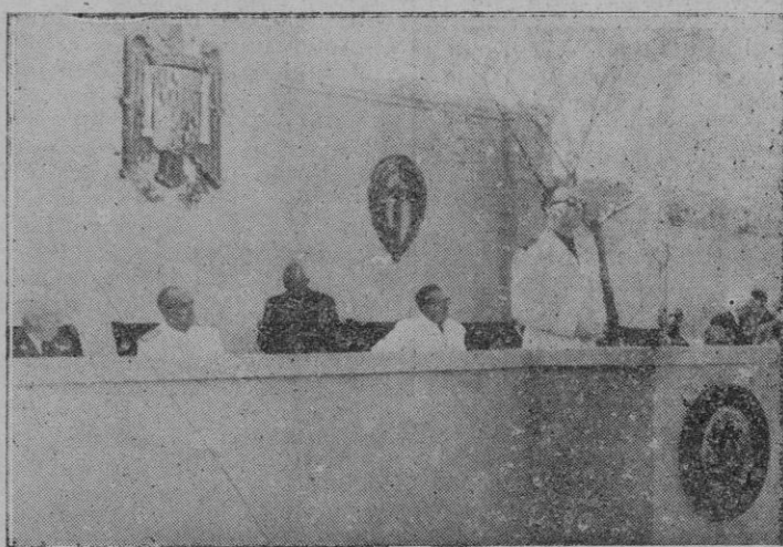
El Sr. Gobernador en la presidencia del acto inaugural, pronunciando el discurso.

A las diez y media de la mañana del domingo, hora previamente fijada, se celebró la benedición e inauguración de la Exposición de Industrias, Feria de Muestras, aquí organizada. El acto revistió verdadera solemnidad, como compete a su importancia y como homenaje al esfuerzo realizado por la Industria y el Comercio de Baleares, cristalización del noble esfuerzo a todas luces logrado que sienten nuestros industriales y comerciantes de superarse y de contribuir a la realización del ideal del nuevo Estado. En el recinto de la Exposición, que en conjunto ofrece ya un brillante golpe de vista, habíase levantado en la explanada frontera al edificio el estrado para las Autoridades que iban a presidir el acto. Ocupó la presidencia el Excelentísimo señor Gobernador Civil y Jefe Provincial del Movimiento, don Manuel Véglison, sentándose a su derecha el Excelentísimo señor Almirante Jefe de la Base Naval de Baleares y Jefe accidental de las fuerzas de Tierra, Mar y Aire, don Manuel Garcés de los Favos; el Excmo. Sr. Gobernador Militar y Capitán General accidental de Baleares, don Antonio Aymat; el Coronel Jefe de la Región Aérea de Baleares, señor Manzanque, y el Comandante Militar de Marina, señor Fontela. Y a su izquierda, el Ilmo. Sr. Comisario General de Ferias y Exposiciones, señor Juan Alemany; el Alcalde, señor Fernández González; el Fiscal, señor Acebal; el Delegado de Hacienda, señor Fons.