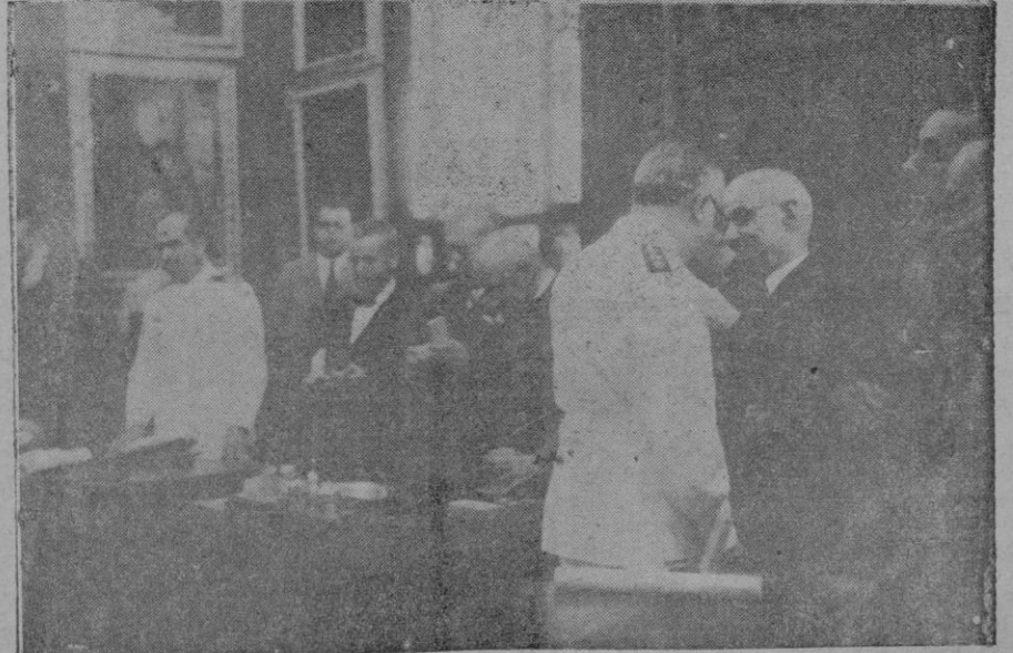
Acto de imposición de Medallas en el Ayuntamiento, el domingo por la mañana