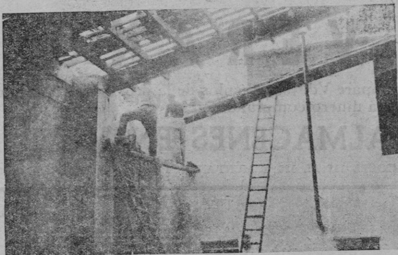
Los obreros en el momento de empezar a derrumbar las cocheras de los coches mortuorios para las obras del Mercado del Olivar

Sebastián Ferrer, de 50 años, gastralgia.