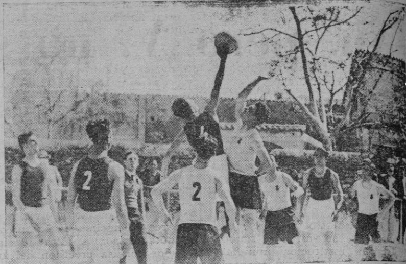
Un momento del partido de Basket-ball, jugado por los equipos de Artillería

Las copas que han de disputarse se hallan expuestas en los escaparates de la Casa Pujol, de Santa Cata-