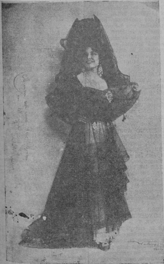
Conchita Supervia que falleció en una clínica de Londres

"Al producirse un choque violento—mas por el resultado que por las actitudes—como el de la elección de Granada, con todo el aparato de retiradas de vocales y dimisiones del presidente, los