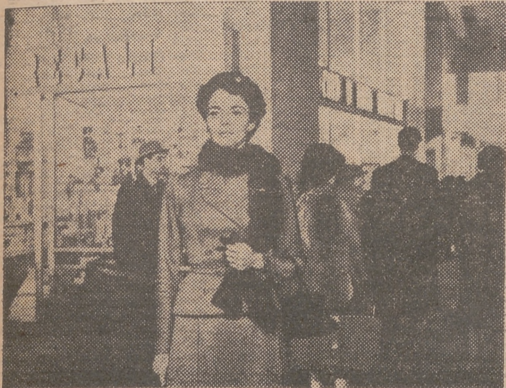
Elizabeth Taylor es la protagonista del más reciente film de Vittorio de Sica: «Estación Terminus», en el que se relata la historia de un amor imposible, transcurriendo la acción estrictamente en los límites de la mejor estación de Roma