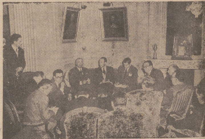
El nuevo embajador de los Estados Unidos de América en España, Mr. James G. Dunn, respondiendo a las preguntas de los periodistas madrileños, en su primera conferencia de prensa celebrada en la capital de España

tan los síntomas siguientes: En los países satélites decretaron también una amnistia para los judíos acusados de espionaje al servicio del enemigo. El semanario satírico de Moscú, "Cocodrilo", no publica esta semana ningún chiste contra la democracia. A los ingleses y norteamericanos les autorizan a mantener la Embajada en Moscú en el mismo sitio que está instalada, derogando la orden de traslado que les dieron hace un año. Los embajadores occidentales son recibidos por Molotov. Y, por