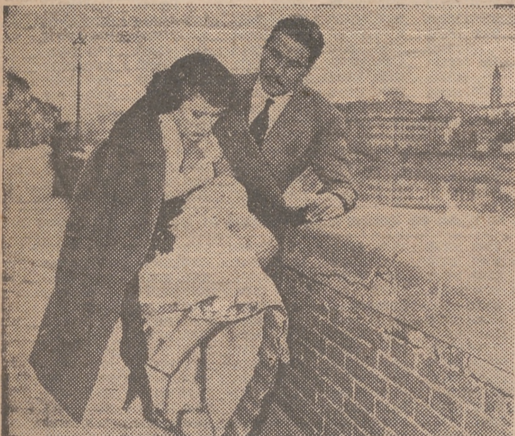
Alida Valli y Amadeo Nazzari, dos de las más prestigiosas estrellas de la cinematografía italiana

tísticas y hasta la intención temática de sus películas.