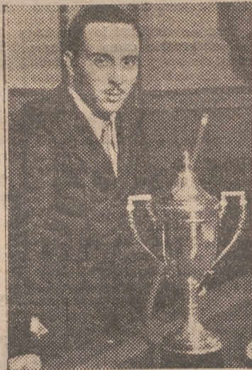
Domingo, el gran billarista ca talán, que ha "arañado" varias veces el título mundial

en Barcelona, la supremacía a tres bandas. En esta época, el billar hispano alcanzaba gran potencialidad,