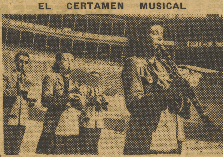
Una de las notas más curiosas del Certamen Musical, fué la actuación de estas señoritas «clarinetistas» de la banda de Puebla Larga. (INFORMACION EN LA SEGUNDA PAGINA)

«La paz no hubiera sido posible para nosotros bajo los sistemas y regímenes que nos precedieron. La libertad de las Naciones está íntimamente ligada a su unidad y a su disciplina, bases indiscutibles de su fortaleza, a la que sólo puede llegarse por el camino de las renunciaciones y de los sacrificios. Los de ayer nos han traído la tranquilidad de hoy. Los que hoy hagamos será causa fehaciente del mañana» (Del discurso del Caudillo ante el Consejo Nacional)