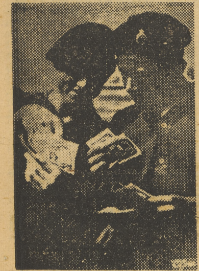
Soldados aliados, transportados por vía aérea a Francia, examinan los billetes de que pueden hacer uso en territorio dominado.

Frente del Este: Los soviets han efectuado varios infructuosos contraataques al Noroeste de Yassi durante el día de ayer. Se señalan combates locales en la región al Noroeste de Tarnopol. Nuestros granaderos blindados destruyeron un batallón y un regimiento antitanque soviéticos en este sector.—Efe.