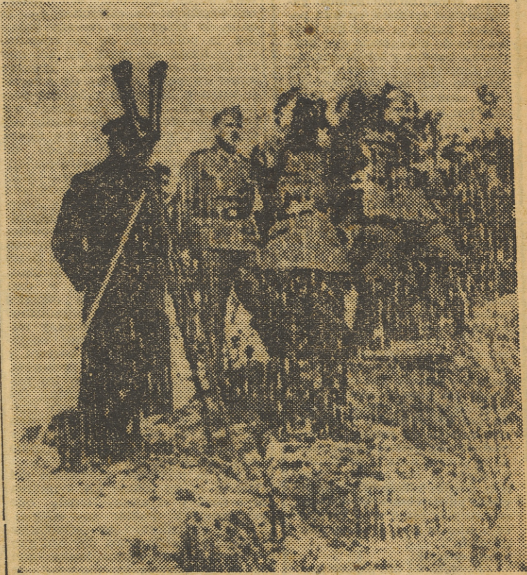
El mariscal general von Rundstedt, con sus oficiales, observa los movimientos del enemigo