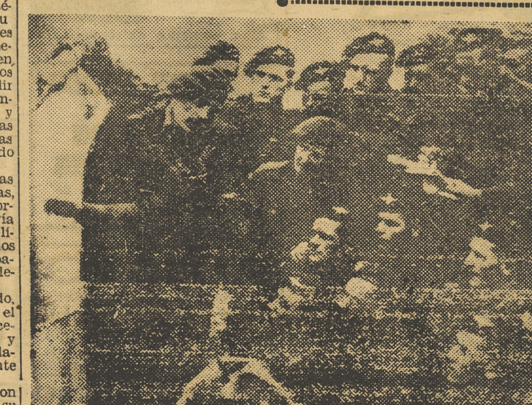
Un grupo de paracaidistas aliados, situados en el territorio invadido, recibe instrucciones de su jefe (Foto Cifra, recibida por radio).