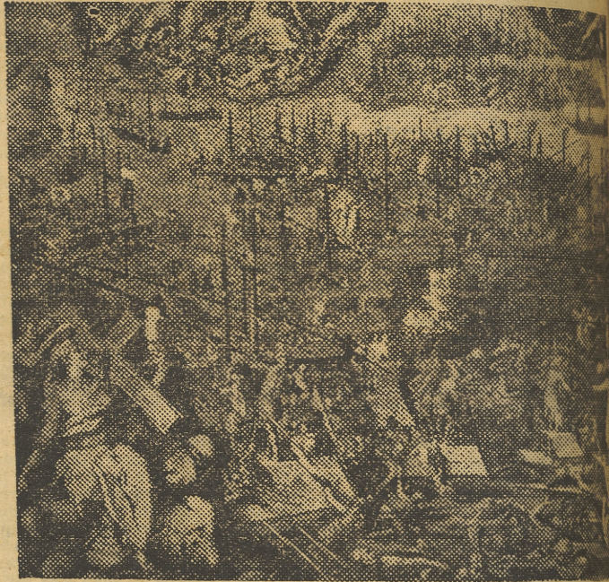
LA BATALLA DE LEPANTO

pió fuego sobre el enemigo cuando lo hizo la Capitana. A las cinco y media, hecha por la señal la señal de seguir su movimiento se largaron las coderas, levó y continuamos batallando sobre la máquina, entre el «Ulloa» y el «Castilla». Poco después de ponernos en movimiento, con aversa en la máquina, tuve que